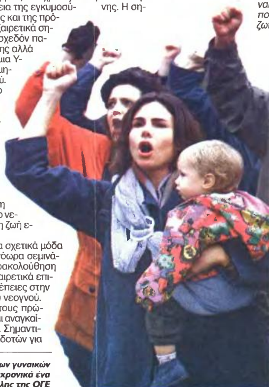
Το ζήτημα της Υγείας, και ιδιαίτερα των γυναικών των λαϊκών οικογενειών, αποτελεί διαχρονικά ένα από τα βασικά μέτωπα πάλης της ΟΓΕ