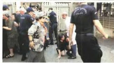
Το αδιακόρητο έξω από τον «Αγιο Σάββα» για μια στιγμή κατάνυξς μπροστά στο σκίνωμα όπου παρέμεινε στο παρεκκλήσι μόνο για 2 ώρες

Δεκάδες χιλιάδες ενγύρ σγκεκινυρόθηκαν από τους πωιούς και θα καιαλήουν στην Αρχιεπισκοπή, η οποία θα διαθέσει μεγάλο μέρος του ποσού σε κοινωνικό έργο, όπως η οικονομηκή ενίσχυση της φουινητικής εστίας για παιδιά άπορων και πολυέκτων οικογενειών