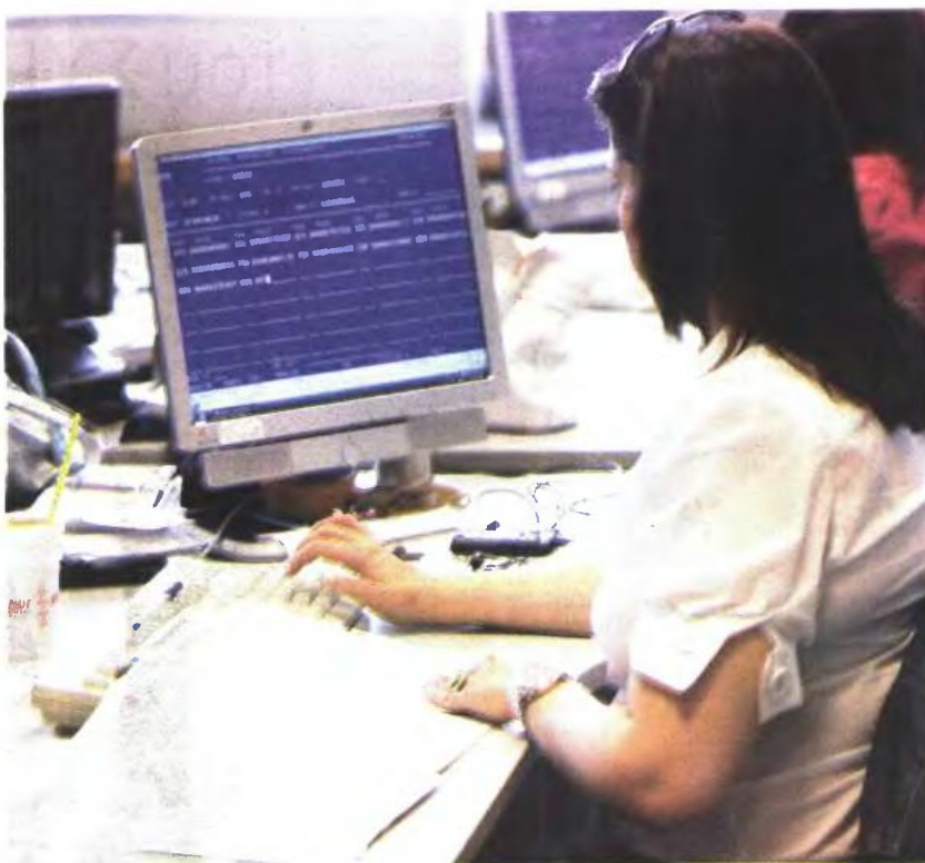
▲ ΠΕΡΑΝ του προγράμματος «οικειοθελούς συμμόρφωσης», το υπουργείο Οικονομικών αναζητά πρόσθετες πηγές άντλησης εσόδων και από την περαίωση των υποθέσεων που εκκρεμούν στα δικαστήρια και οι οποίες υπολογίζονται συνολικά σε πάνω από 64.000

■ Φόρους κύκλου εργασιών και ασφαλίσεων.