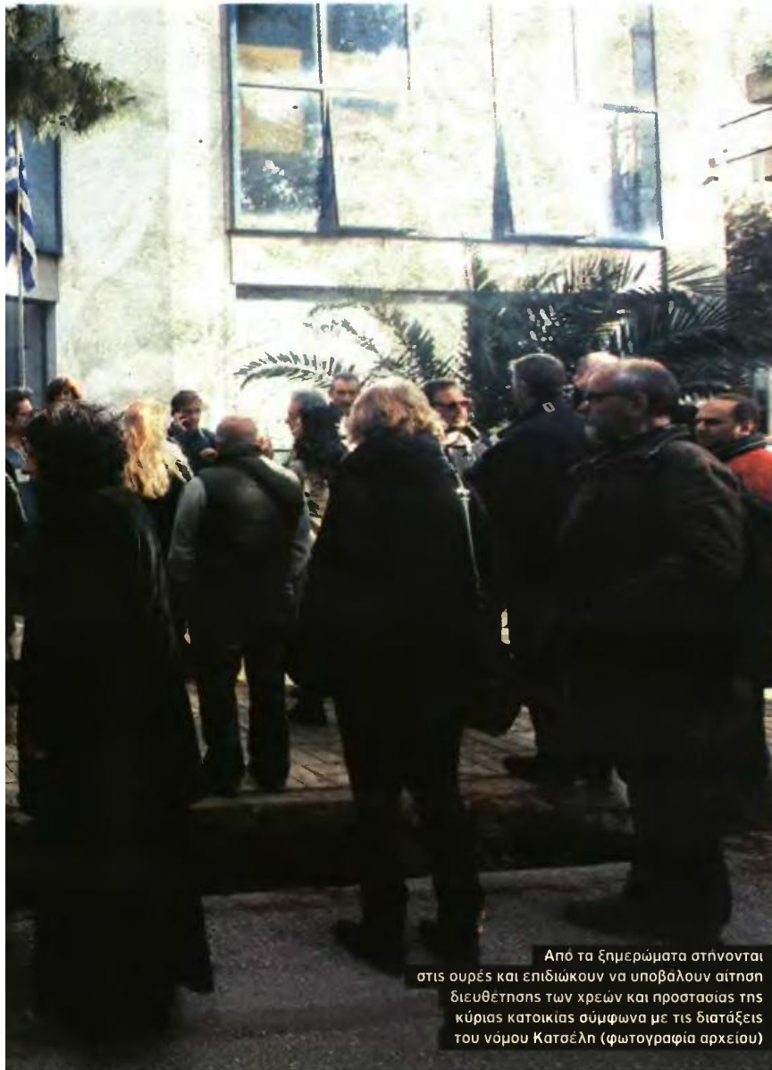
Από τα ξημερώματα στήνονται στις ουρές και επιδιώκουν να υποβάλουν αίτηση διευθέτησης των χρεών και προστασίας της κύριας κατοικίας σύμφωνα με τις διατάξεις του νόμου Κατσέλη (φωτογραφία αρχείου)