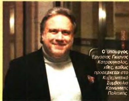
Ο υπουργός Εργασίας Γιώργος Κατρούγκαλος, χθες, καθώς προερχόταν στο Κυβερνητικό Συμβούλιο Κοινωνικής Πολιτικής

χόμενο, πλην όμως άφησε ανοιχτό το θέμα και το συνέδεσε με το σύνολο της πρότασης που θα παρουσιάσει η ελληνική κυβέρνηση για τη σχεδιαζόμενη ασφαλιστική μεταρρύθμιση. β. Η αύξηση της εισφοράς κατά 2% για τον κλάδο υγείας σε 2,6 εκατ. κύριες συντάξεις θα αποφέρει 570 εκατ. ευρώ. Το μέτρο αυτό έχει ήδη εφαρμοστεί και συνεπώς η κοστολόγησή του είναι αιτιολογημένη βάσει των στοιχείων που διαθέτει το σύστημα «Ηλιος» του υπουργείου Εργασίας. Το ίδιο ισχύει και για τις επικουρικές συντάξεις. γ. Η επιβολή της εισφοράς 6% σε 1,6 εκατ. επικουρικές συντάξεις θα αποφέρει 180 εκατ. ευρώ. δ. Η απόδοση στο υπουργείο Εργασίας της ειδικής εισφοράς αλληλεγγύης στις επικουρικές συντάξεις (σήμερα το κονδύλι αυτό κατευθύνεται στο Αρμόβαιο Κεφάλαιο Αλληλεγγύης Γενεών) θα αποφέρει 130 εκατ. ευρώ. ε. Η περικοπή του ΕΚΑΣ σε