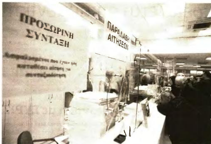
Η ελληνική πλευρά δεν μένει μόνο στο θέμα της μείωσης της ασφαλιστικής δαπάνης για το 2016, αλλά θα καταθέσει συνολικό σχέδιο για τη μεταρρύθμιση του ασφαλιστικού ώστε να εξασφαλιστεί η μακροπρόθεσμη βιωσιμότητά του