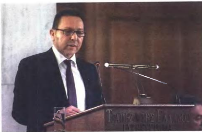
Ο διοικητής της Τράπεζας της Ελλάδος Γιάννης Στουρνάρας (εδώ σε παλαιότερη ομιλία του) διατύπωσε μεταξύ άλλων ανησυχίες για την πορεία εκτέλεσης του κρατικού προϋπολογισμού.

Οι προβλέψεις για την πορεία της οικονομίας παραμένουν ίδι-