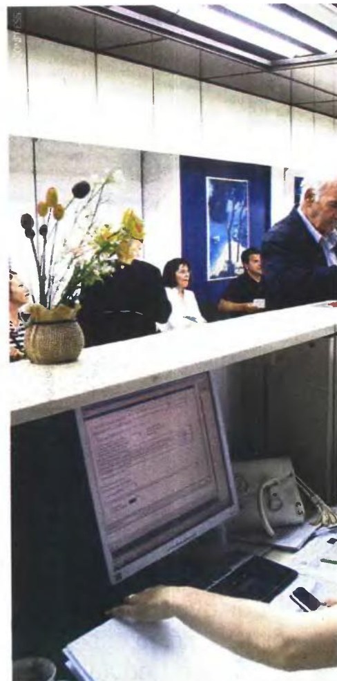
Κίνητρα συνταξιοδότησης στους δημοσίους υπαλλήλους με προσαύξηση

Οι χρόνοι αυτοί δεν θεωρούνταν συντάξιμοι και με το νομοσχέδιο παρέχεται η δυνατότητα στους δημοσίους υπαλλήλους να τους αναγνωρίσουν καταβάλλοντας οι ίδιοι τις προβλεπόμενες ασφαλιστικές εισφορές, είτε για να θεμελιώσουν συνταξιοδοτικό δικαίωμα είτε και για προσαύξηση της σύνταξής τους, στην περίπτωση που έχουν ήδη θεμελιωμένο δικαίωμα. Με τη διάταξη αυτή