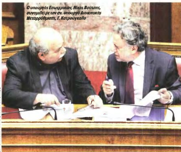
Ο υπουργός Εσωτερικών, Νίκος Βούζιας, συνομιλεί με τον αν. υπουργό Διοικητικής Μεταρρύθμισης, Γ. Κατρούγκαλο