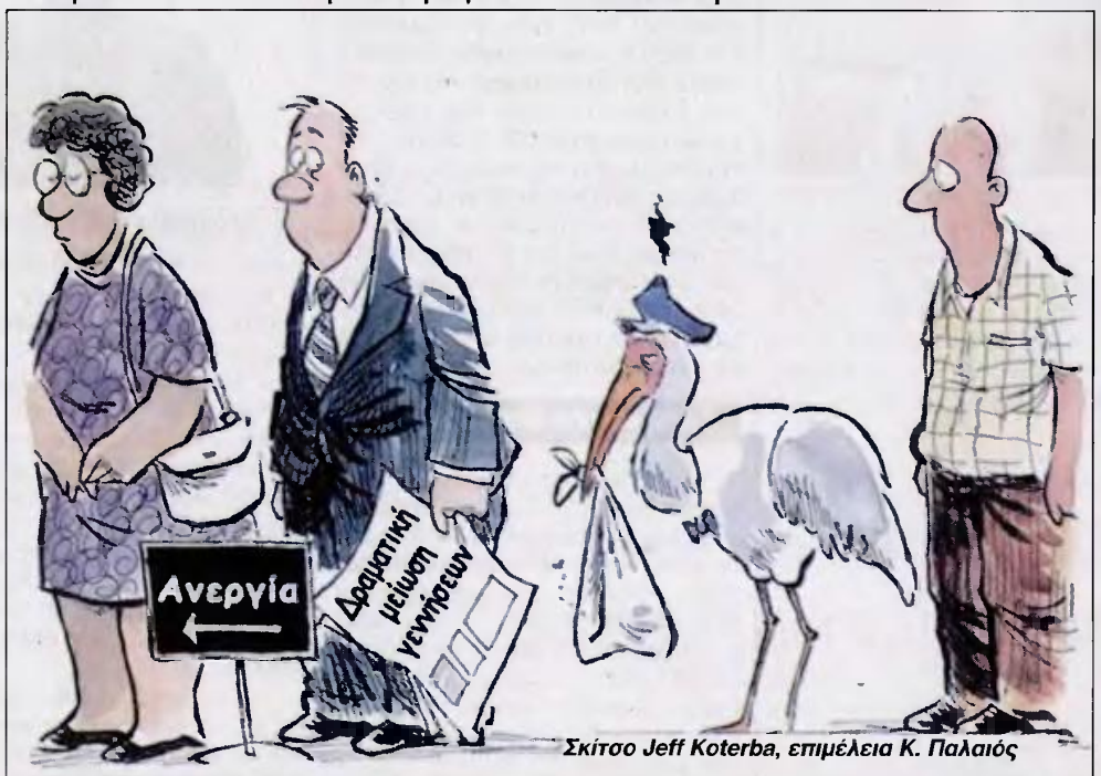
Σκίτσο Jeff Koterba, επιμέλεια Κ. Παλαιός

Είναι το γεγονός πως από τα μέσα της προηγούμενης δεκαετίας και ύστερα, αρχίζει να έχει αρνητική ροπή ο συσχετισμός γεννήσεις-θάνατοι και φθάνουμε τα τελευταία έτη να μιλάμε για ελάχιστες γεννήσεις. Συγκεκριμένα το