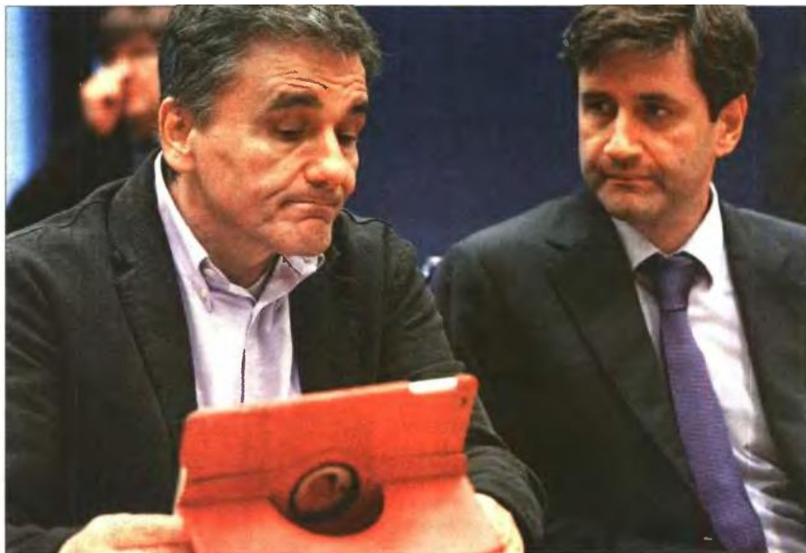
Ο υπ. Οικονομικών Ευκλείδης Τσακαλώτος (αριστερά) με τον αναπληρωτή του Γιώργο Κουλιμαράκη σε παλαιότερο στιγμιότυπο