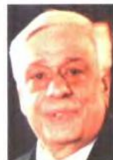
Ο Πρ. Παυλόπουλος

Το απόγευμα η κυρία Θάνου θα τελέσει τα εγκαίνια της έκθεσης «Μαγεμένες», στο περίπτερο 3 της Έκθεσης, ενώ το βράδυ θα απευθύνει χαιρετισμό στα εγκαίνια της ΔΕΘ.