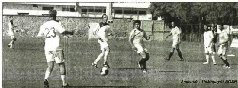
Λιμενικό - Παλαίμαχοι ΑΟΑΝ