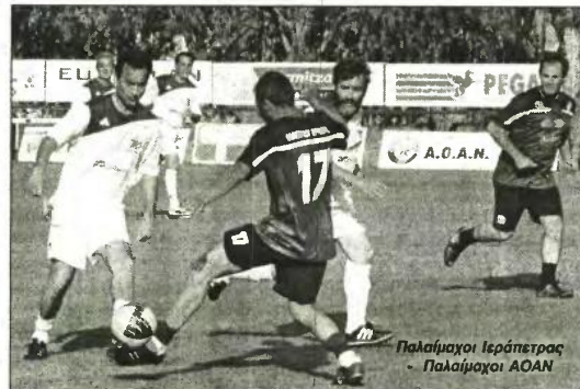
Παλαίμαχοι Ιεράπετρας - Παλαίμαχοι ΑΟΑΝ