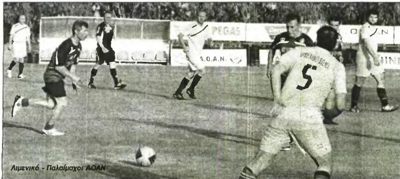
Λιμενικό - Παλαίμαχοι ΑΟΑΝ