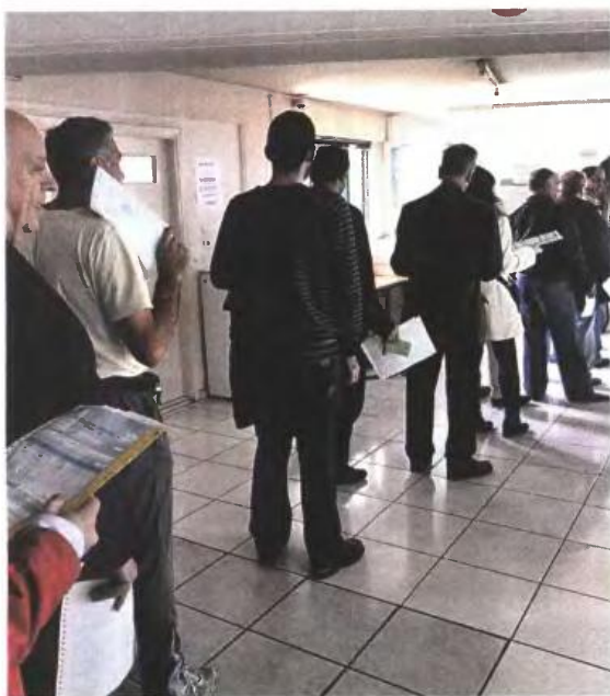
Σε περιπτώσεις θανάτου ή διαζυγίου ο φορολογούμενος είναι αναγκασμένος να παρουσιασθεί στην Εφορία.

Είσαι ένας από αυτούς που θα πρέπει να πάνε στην Εφορία; Φέτος, η Γενική Γραμματεία Δημοσίων Εσόδων σκοπεύει να καταρρίψει ακόμη ένα ρεκόρ: Πέρυσι υποβλήθηκαν ηλεκτρονικά 5.811.933 δηλώσεις και φέτος ο πήχυς έχει ανέβει περίπου στα 6 εκατομμύρια.