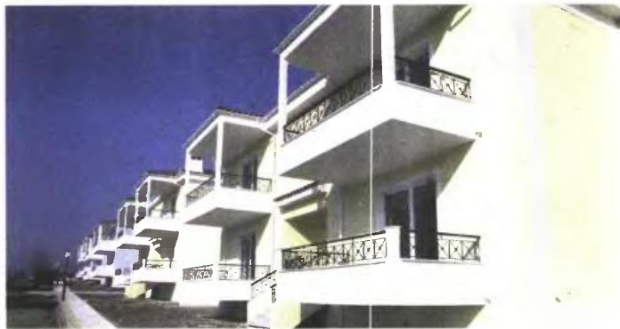
Η κυβέρνηση κατέθεσε τροπολογία που έδωσε πάλι το δικαίωμα στους φορολογούμενους να εκχωρήσουν το ανείσπρακτο εισόδημα από ενοίκια στην Εφορία.

Η εκχώρηση γίνεται με την υποβολή του συμπληρωμένου εντύπου δήλωσης εκχώρησης από τον εκχωρητή (δηλαδή, τον ιδιοκτήτη) στον αρμόδιο για την παραλαβή της φορολογικής δήλωσης του προϊστάμενο της ΔΟΥ. Σύμφωνα με τη σχετική απόφαση, η δήλωση πρέπει να γίνει «μετά το πέρας του φορολογικού έτους στο οποίο αφορούν τα ενοίκια» (δηλαδή, μετά την 31/12/2014) και «πριν από την εμπρόθεσμη υποβολή της ετήσιας δήλωσης Φορολογίας Εισοδήματος» (δηλαδή, πριν από τις 30/06 μέχρι νεωτέρας). Προσοχή: «Σε περίπτωση υποβολής της δήλωσης εκχώρησης εκπρόθεσμα, μετά την υποβολή της εμπρόθεσμης ετήσιας δήλωσης Φορολογίας Εισοδήματος η εκχώρηση δεν γίνεται δεκτή». Στη δήλωση αναγράφονται