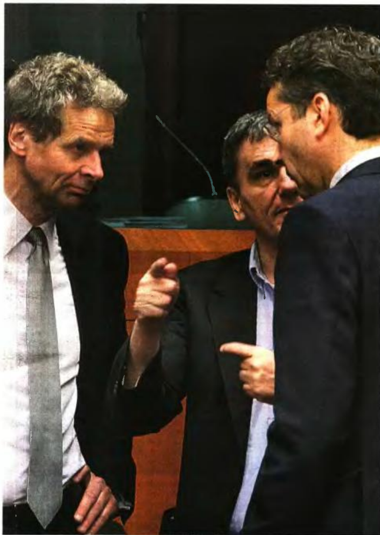
Πολ Τόμσεν, Ευκλείδης Τσακαλώτος και Γερμάνο Ντάισελμπλουμ στο Ευρογκρουπ της περασμένης Πέμπτης στις Βρυξέλλες... Μεγάλο το πρόβλημα

Ταυτόχρονα οι θεσμοί επιθυμούν μια συνολική διαπραγμάτευση με κορμό το Ασφαλιστικό, χωρίς εκπτώσεις για το σύνολο των θεμάτων που παραμένουν σε εκκρεμότητα. Αυτό σημαίνει ότι θα πρέπει να υπάρξει συμφωνία και για τα ζητήματα του Εργασιακού, του Δημοσίου και το Φορολογικό. Στο τελευταίο περιλαμβάνουν τη φορολόγηση των αγροτών, την ενσωμάτωση στη φορολογική κλίμακα της πρώην έκτακτας και νυν εισφοράς αλληλεγγύης κ.ά. Επιπλέον θα πρέπει να κλείσουν θέματα όπως η συγκρότηση του νέου Ταμείου Αποκρατικοποιήσεων, αλλά και το πλαίσιο για τη διαχείριση των κόκκινων δανείων. Στον προηγούμενο κύκλο διαπραγματεύσεων για τα κόκκινα δάνεια δεν υπήρξε