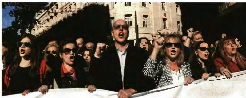
Οι υπέρμετρες αυξήσεις στις εισφορές αλλά και οι μεγάλες μειώσεις στις συντάξεις είναι τα σημεία του σχεδίου που συγκεντρώνουν τις περισσότερες αντιδράσεις εργαζομένων και επαγγελματιών. Ηδη εκδηλώθηκε η πρώτη μεγάλη κινητοποίηση δικηγόρων, γιατρών, μηχανικών και φαρμακοποιών, ενώ ακολούθησαν οι δημόσιοι υπάλληλοι αλλά και η ΓΣΕΕ με την 24ωρη γενική απεργία στις 4 Φεβρουαρίου

Το πακέτο αυτό, όπως είναι φανερό, είναι εξαιρετικά δύσκολο να γίνει αποδεκτό από την κυβέρνηση, στελέχη