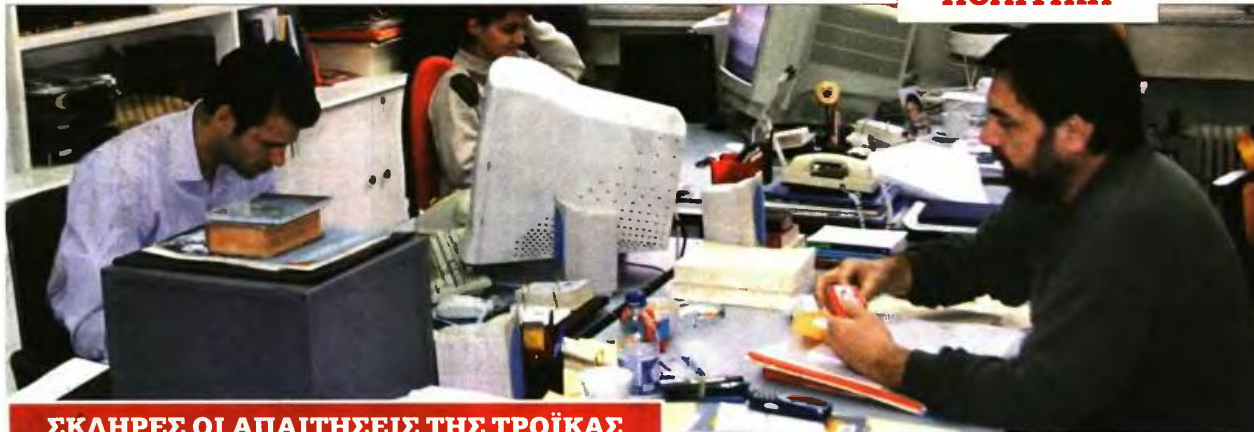
ΣΚΛΗΡΕΣ ΟΙ ΑΠΑΙΤΗΣΕΙΣ ΤΗΣ ΤΡΟΪΚΑΣ