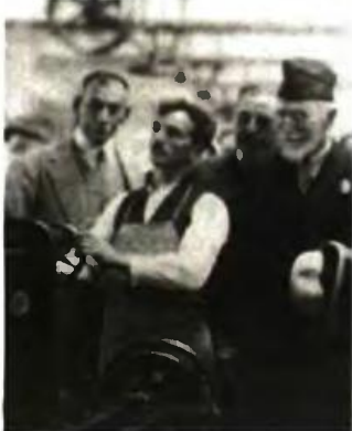
Πάνω, ο Αλέξανδρος Παπαναστασίου (αριστερά) με τον Ελευθέριο Βενιζέλο. Το Ασφαλιστικό σφράγισε το χάσμα που τους χώριζε. Κάτω, ο Βενιζέλος σε εργοστάσιο της εποχής.