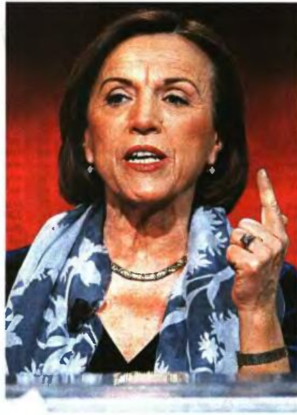
Η καθηγήτρια και πρώην υπουργός Κοινωνικών Υποθέσεων στην κυβέρνηση Μόντι Ελσα Φορνέρο

Η Ελσα Φορνέρο που προχώρησε τη μεταρρύθμιση του ασφαλιστικού συστήματος στην Ιταλία μιλάει για την ανάγκη αλλαγών στην κοινωνική ασφάλιση. «Δεν αρκεί να ψηφίσεις μια μεταρρύθμιση, πρέπει και να την εφαρμόσεις» υποστηρίζει