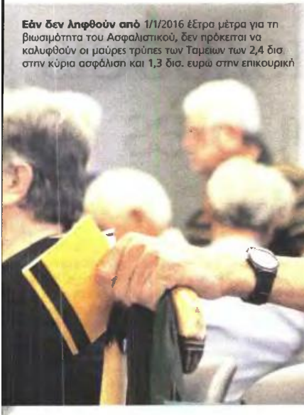
Εάν δεν ληφθούν από 1/1/2016 έξτρα μέτρα για τη βιωσιμότητα του Ασφαλιστικού, δεν πρόκειται να καλυφθούν οι μύρες τρύπες των Ταμείων των 2,4 δισ στην κύρια ασφάλιση και 1,3 δισ. ευρώ στην επικουρική

κατώτατη και κορήγηση του προνοιακού επιδόματος στα 67 είναι μόνο κάποιες από τις νέες ρυθμίσεις, που προβλέπουν και ενοποίηση των ταμείων κύριας ασφάλισης