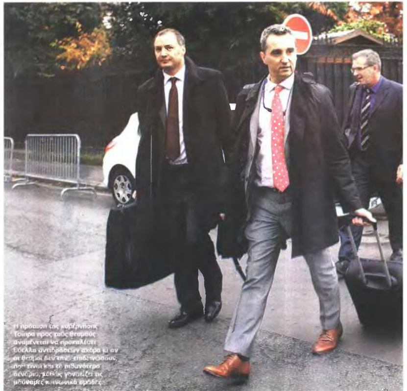
Η πρόταση της κυβέρνησης Τσίπρας προς τους θεμελιώδεις δανειστές προέβλεπε ακόμα κι αν επιλεγεί να μην υπάρξει επιπλέον μείωση, η μείωση των εισφορών θα είναι μεγαλύτερη από 5%, λόγω των κρατήσεων που θα γίνονται στα ποσά συντάξεων του 2009.

Με αύξηση του ορίου ηλικίας συνταξιοδότησης κατά 6 ή και 12 μήνες