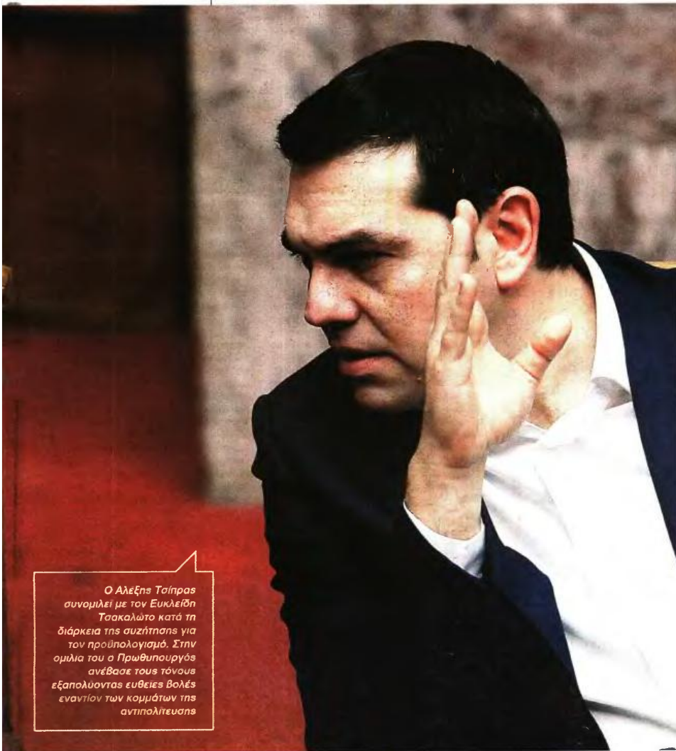
Ο Αλέξης Τσίπρας συνομιλεί με τον Ευκλείδη Τσακαλώτο κατά τη διάρκεια της συζήτησης για τον προϋπολογισμό. Στην ομιλία του ο Πρωθυπουργός ανέβασε τους τόνους εξαρτώντας ευθείες βοήθες εναντίον των κομμάτων της αντιπολίτευσης

βέντης επέμεινε στην πρότασή του για οικογενειακή κυβέρνηση, υποστηρίζοντας ότι δεν τον πειράζει να παραμείνει στη θέση του Πρωθυπουργού ο Αλέξης Τσίπρας. Εκκαθάρισε όμως ότι «η εικόνα των υπουργών δεν του αρέσει και αυτοί πρέπει να είναι τεκνοκράτες». Η Φώφη Γεννηματά τάχθηκε υπέρ του διαλόγου και της εθνικής συνεννόησης μόνο αν πρόκειται «για επανεκκίνηση της οικονομίας» και «να αλλάξουμε το κράτος, τη διοίκηση, με προοδευτικές μεταρρυθμίσεις». Και όλα αυτά μόνο στη Βουλή, «με ανοιχτές πόρτες και καθαρές προτάσεις που δεν θα υπονομεύουν το κύρος των θεσμών». Ο Σταύρος Θεοδωράκης καταγγέροντας την κυβέρνηση ότι ψάχνει «σανίδα σωτηρίας» και έχει κόψει τις γέφυρες με τη δημιουργική Ελλάδα. «Στον δρόμο που ακολουθείτε, είμαστε αντίπαλοι» ξεκαθάρισε. Από την πλευρά του ο γ.γ. του ΚΚΕ Δημήτρης Κουτσούμπας υποστήριξε ότι «ένας χρόνος διακυβέρνησης από την Αριστερά του κεφαλαίου ήταν αρκετός για να πάσει η σαπιουνόφρουσα περί διαχείρισης του κεφαλαίου».