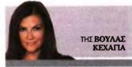
ΤΗΣ ΒΟΥΛΑΣ ΚΕΧΑΠΙΑ

Σε μοναχικό δρόμο – και με τη στρατηγική της έντασης στο οπλοστάσιό της – έχει αποφασίσει να πορευτεί η κυβέρνηση, αφήνοντας πίσω της την προσπάθεια εξεύρεσης συναίνεσης με τις δυνάμεις της αντιπολίτευσης.