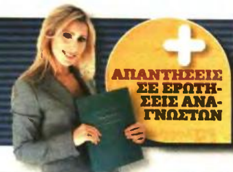
ΠΙΝΑΚΑΣ ΜΕ ΤΑ ΟΡΙΑ ΣΥΝΤΑΞΙΟΔΟΤΗΣΗΣ ΜΕΤΑ ΤΙΣ ΑΛΛΑΓΕΣ ΣΤΟ ΑΣΦΑΛΙΣΤΙΚΟ

Όσοι γονείς δεν έχουν συμπληρώσει τα όρια ηλικίας θα δουν το όριο συνταξιοδότησης να αυξάνεται από 6 μήνες έως 15 χρόνια