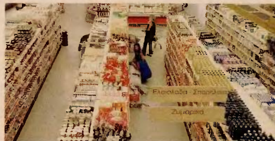
Η συνολική αξία των αγορών τροφίμων από τα ελληνικά νοικοκυριά διαμορφώθηκε, το 2013, στα 19,5 δισ. ευρώ.

Όσον αφορά τα νησιά του Αιγαίου, από 1 Οκτωβρίου 2015 καταργούνται οι εκπτώσεις στα αναπτυγμένα τουριστικά νησιά με το υψηλότερο κατά κεφαλήν εισόδημα και από 1 Ιουνίου 2016 στα λιγότερο αναπτυγμένα νησιά. Σε ισχύ παραμένουν οι χαμηλοί συντελεστές ΦΠΑ στα πλέον απομακρυσμένα νησιά. Στα ξενοδοχεία ο νέος αυξημένος συντελεστής 13% θα εφαρμοσθεί από τον Οκτώβριο. Σελ. 19