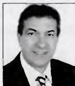
Γιώργος Βάμβουκας Καθηγητής του Οικονομικού Πανεπιστημίου Αθηνών (ΑΣΟΕΕ)