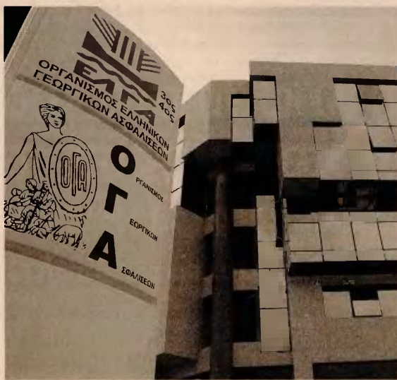
Επαναφέρουν τη σύνταξη σε περίπου 30.000 ανασφάλιστους υπερηλικές του ΟΓΑ.

διατάξεις που έχουν εξαγγελθεί, πολλές δε από αυτές αποτελούσαν προεκλογική δέσμευση της κυβέρνησης ΣΥΡΙΖΑ, όπως για παράδειγμα η αποκατάσταση των συντάξεων στους ανασφάλιστους υπερηλικές, η συγκυρία κατά την οποία κατατίθεται και το συνολικό κόστος με το οποίο επιβαρύνονται τα δημόσια οικονομικά