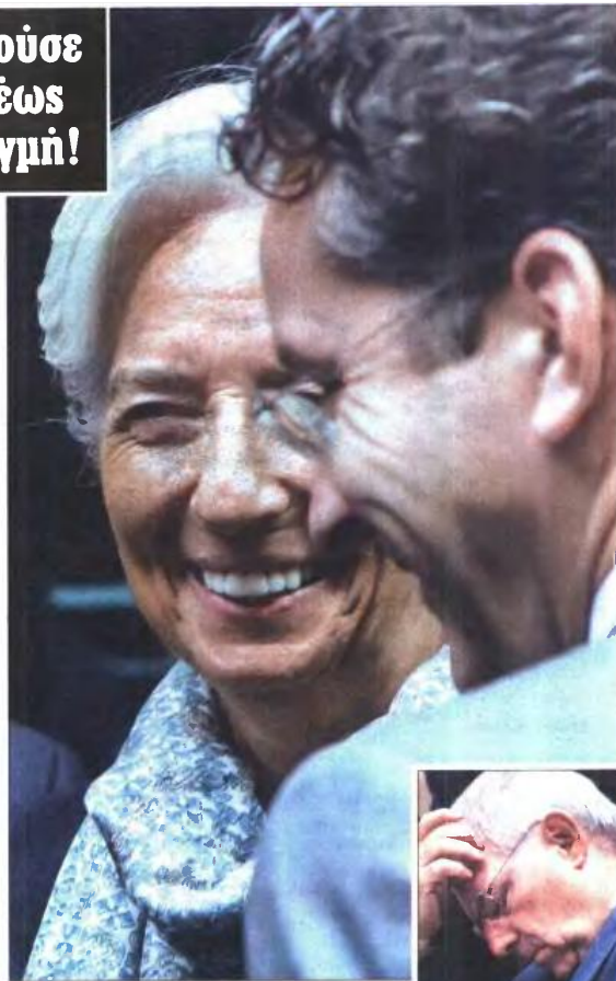
Η Κριστίν Λαγκράντ με τον Γέρουν Ντάισελμπλουμ στη χθεσινή συνεδρίαση του Eurogroup στις Βρυξέλλες. Δεξιά: Ο Β. Σόιμπλε

Πριν από τις δηλώσεις αυτές, η ελληνική πλευρά είχε υποστεί για άλλη μία φορά τη δοκιμασία του σκοτεινού τунελ. Ενώ ο επιτελάρχης του προέδρου της Κομισιόν Ζαν Κλονί Γούνγκερ, Μάριν Σελμάνγκερ, ανέφερε χθες τα ζημειώματα με μίνιμουμ στο twitter ότι η πρόταση της κυβέρνησης «αποτελεί καλή βάση για πρόοδο στη Σύνοδο της ευρωζώνης» και την παρομοίωσε με εμβρυολογικό τοκετό, λίγες ώρες αργότερα ο Γερμανός υπουργός Οικονομικών Βόλφγκανγκ Σόιμπλε, προσερχόμενος στο Eurogroup, για άλλη μία φορά έσταξε φάρμακι. Υποστήριξε ότι δεν υπήρξαν «ουσιαστικές προτάσεις» από ελ-