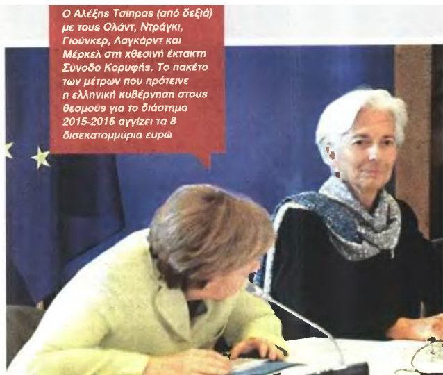
Ο Αλέξης Τσίπρας (από δεξιά) με τους Ολάντ, Ντράγκι, Γιούνκερ, Λαγκάρντ και Μέρκελ στη χθεσινή έκτακτη Σύνοδο Κορυφής. Το πακέτο των μέτρων που πρότεινε η ελληνική κυβέρνηση στους θεσμούς για το διάστημα 2015-2016 αγγίζει τα 8 δισεκατομμύρια ευρώ

Από τα αξιοσημείωτα της χθεσινής ημέρας ξεχωρίζει το γεγονός πως για πρώτη φορά στους πέντε μήνες της διαπραγμάτευσης ο Γερούν Ντεϊσελμπλούμ εκφράστηκε θετικά για το περιεχόμενο των ελληνικών προτάσεων, κάτι που μετέδωσε αργότερα και με τις δηλώσεις του μετά το σύντομο Eurogroup λέγοντας ότι «θα δουλέψουμε μαζί με τις ελληνικές Αρχές τα προσπατούμενα ώστε να οδηγηθούμε σε συμφωνία περί τα τέλη της εβδομάδας». Ομοίως ο Πιερ Μοσκοβισί είπε ότι η ελληνική πρόταση είναι σε θετική κατεύθυνση.