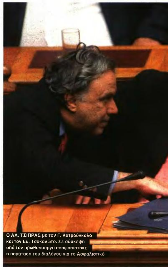
Ο Α.Λ. ΤΣΙΠΡΑΣ με τον Γ. Κατρούγκαλο και τον Ευ. Τασκαλώτο, Σε σύσκεψη υπό τον πρωθυπουργό αποφασίστηκε η παράταση του διαλόγου για το Ασφαλιστικό

«Εντάξει, είναι μία άποψη η αυτή. Είναι στο επίπεδο της κοινοβουλευτικής ενίσχυσης της πλειοψηφίας. Δεν μιλάει κανείς για συγκυβέρνηση και για κυβερνητική συνεργασία. Αυτό είναι άλλο θέμα. Κυβερνητική συνεργασία, κυβέρνηση οικονομική, όσο κι αν το θέλουν κάποιοι δεν πρόκειται να τη δουν» επεσήμανε η κυρία Γεροβασίλη κρατώντας σαφείς αποστάσεις από τις απόψεις του υπουργού Επικρατείας.