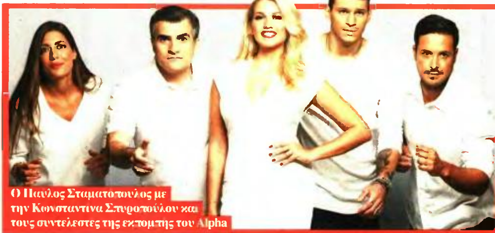
Ο Παύλος Σταματόπουλος με την Κωνσταντίνα Σπυροπούλου και τους συντελεστές της εκπομπής του Alpha

Ο Παύλος Σταματόπουλος βρήκε για δεύτερη συνεχή σεζόν το «Σπίτι του, σπατάκι του», δίπλα στην Κωνσταντίνα Σπυροπούλου, στον Alpha.