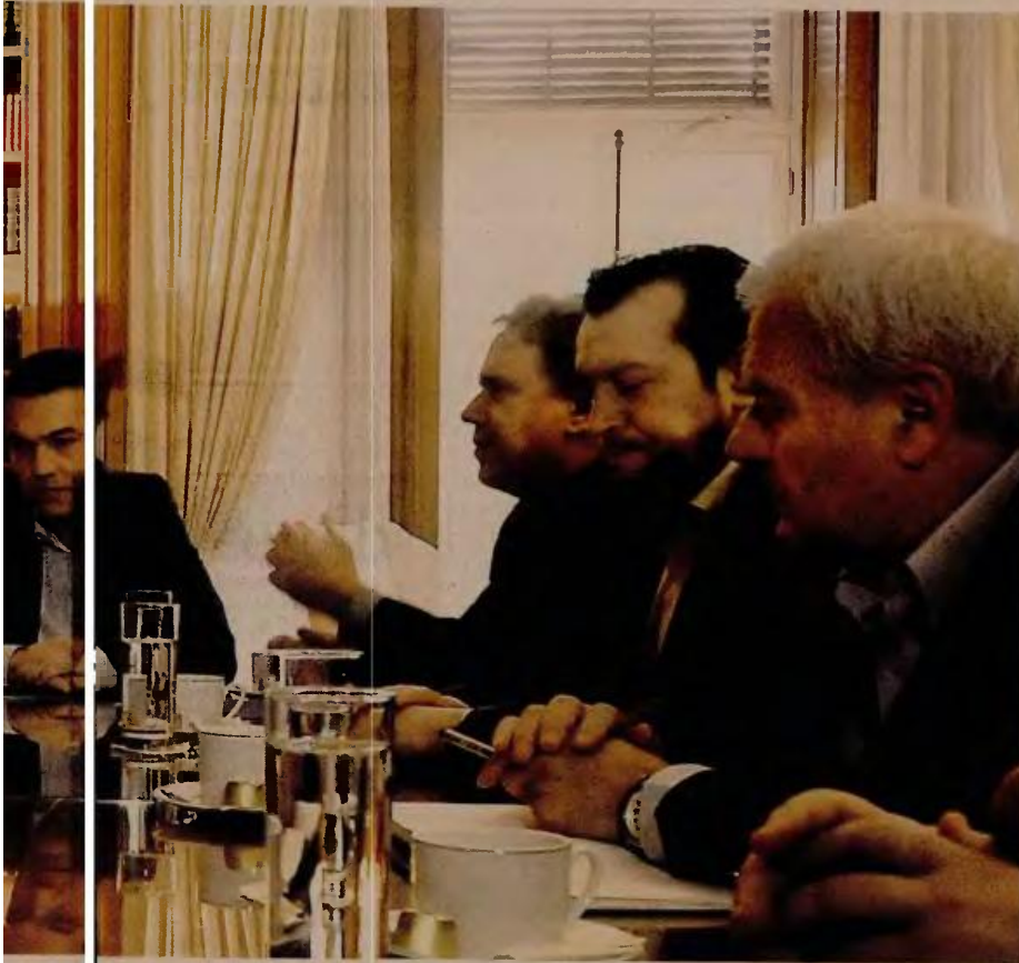
«Ναι» υπό όρους για την αύξηση των ασφαλιστικών εισφορών κατά μία μονάδα είπαν οι εκπρόσωποι των εργοδοτικών φορέων στον πρωθυπουργό Αλέξη Τσίπρα, με τον οποίο συναντήθηκαν την περασμένη Πέμπτη στο Μέγαρο Μαξίμου

κά μέτρον κυβέρνηση. Σύμφωνα με το σχέδιο επεξεργάζεται το υπουργείο Εργασίας η φορολογία 20% θα επιμεριστεί κατά 13,3% στον εργοδότη και κατά 6,3% στον εργαζόμενο.