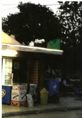
ο πρόεδρος της Ένωσης Καπνοπωλών Αθήνας