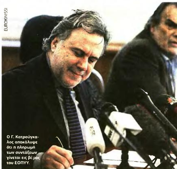
Ο Γ. Κατρούγκαλος αποκάλυψε ότι η πληρωμή των συντάξεων γίνεται εις βέρος του ΕΟΠΥΥ.

Ενστάσεις Αυτά είπε χθες ο υπουργός Εργασίας προδιαγράφοντας εμμέσως και τα σημεία των διαφωνιών με την τρόικα, που είναι τουλάχιστον δύο και θεωρούνται τα κλειδιά για το αν τελικώς θα πιέσουν για άμεσες μειώσεις και των κύριων συντάξεων (σ.σ.: μια που για τις επικουρικές το ψαλίδι για τα ποσά άνω των 170 ευρώς παραμένει στο τραπέζι). Οι ενστάσεις που αναμένονται από την τρόικα έχουν να κάνουν: