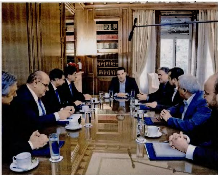
Ο πρωθυπουργός Αλέξης Τσίπρας κατά τη χθεσινή συνάντηση που είχε στο Μέγαρο Μαξίμου με τους εκπροσώπους των εργοδοτικών οργανώσεων, με θέμα το ασφαλιστικό.

Η αύξηση των εισφορών αφορά, βεβαίως, και τους εργαζόμενους, και εκεί στην κυβέρνηση αναγνωρίζουν ότι η εξασφάλιση θετικής ανταπόκρισης δεν είναι εύκολη, παρά την επίκληση της ανάγκης επιδείξεως και από αυτούς κοινωνικής αλληλεγγύης, προκειμένου να προστατευθούν οι περισσότερο αδύναμοι. Μάλιστα, στο Μαξίμου δεν κρύβουν τη δυσφορία τους για τη στάση που κράτησε η ΓΣΕΕ, για την οποία αναφέρουν ότι έπεισε από τους πρώτους να καταγγείλει «σφαγή» και «λεπλάσια», μόλις δημοσιοποιήθηκε η κυβερνητική πρόταση. Αφήνοντας σαφείς υπαινιγμούς ότι η ΓΣΕΕ τοποθετείται με πολιτικά κίνητρα έναντι της κυβέρνησης, συνεργάτες του πρωθυπουργού αποτυπώνουν κλίμα ανοικτής αντιπαράθεσης, καθώς σπεύδουν να αναφέ-