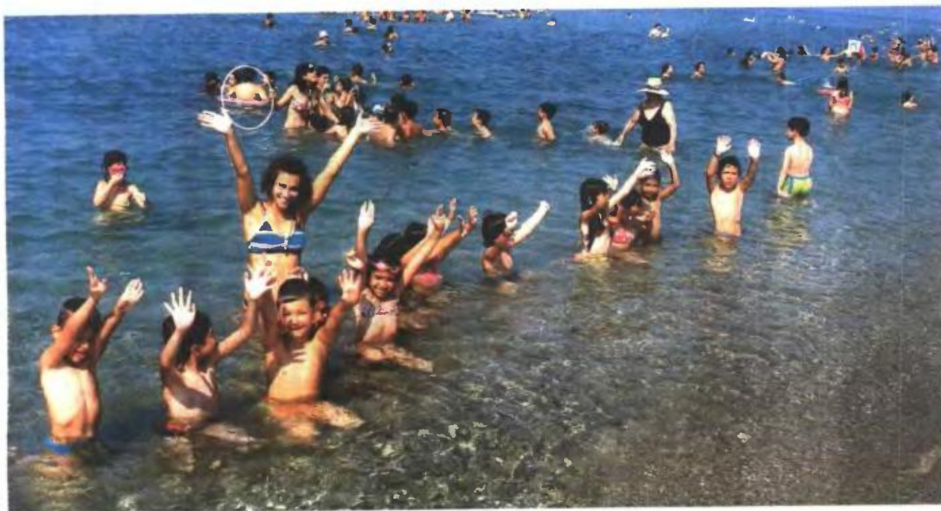
Σε αρκετά προγράμματα των δήμων η συμμετοχή προϋποθέτει και οικονομικό κόστος

Μπορεί τα παιδιά να μετρούν αντίστροφα και να ανυπομονούν να κλείσουν τα σχολεία, ώστε να «πετάξουν» μακριά τις τσάντες και τα βιβλία, όμως για τους γονείς η φύλαξη των μικρών τους «θησαυρών» αποτελεί πρόβλημα τους καλοκαιρινούς μήνες.