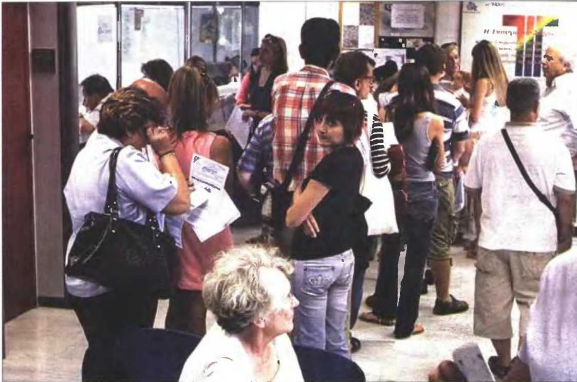
Ουρές φορολογουμένων σε ΔΟΥ