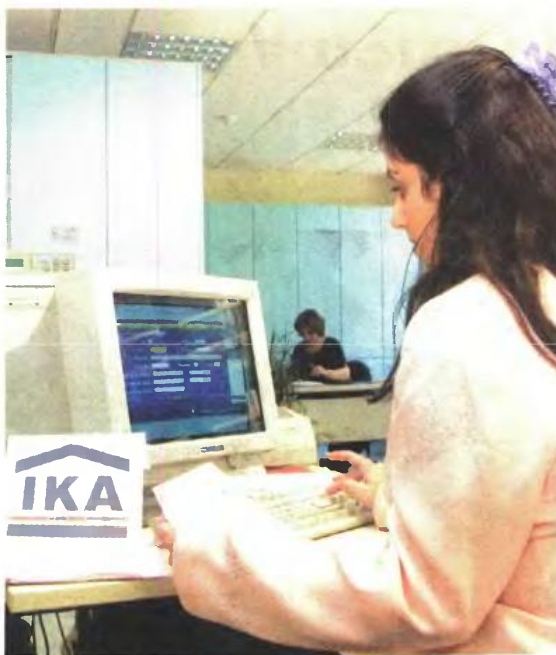
▲ ΚΟΙΝΑ ΣΗΜΕΙΑ ΣΕ ΣΥΓΚΕΚΡΙΜΕΝΟΥΣ τομείς στο Ασφαλιστικό έχουν βρει κυβέρνηση και δανειστές

λισμένοι έχουν πιάσει τόσο τα έτη ασφάλισης όσο και το όριο ηλικίας και επομένως μπορούν να αποχωρήσουν ανά πάσα στιγμή. Οι συγκεκριμένοι ασφαλισμένοι δεν απειλούνται από αλλαγές στα θεμελιωμένα δικαιώματά τους.