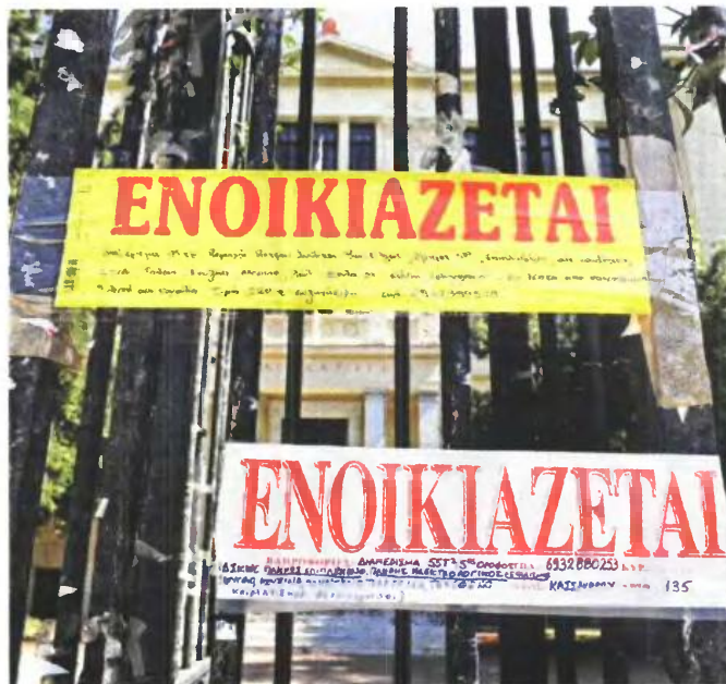
Για τους νέους φοιτητές, που πρόκειται να μετακομίσουν για πρώτη φορά από την ασφάλεια του πατρικού τους σπιτιού, η ενοίκιαση του δικού τους χώρου είναι μια ευχάριστη διαδικασία παρά τις πρακτικές δυσκολίες. Στη φοιτητούπολη Θεσσαλονίκη τα ενοικιαστήρια καταλαμβάνουν ήδη κάθε διαθέσιμο χώρο στα πανεπιστήμια.

Σημειώνεται ότι το πρόβλημα συντήρησης αφορά κατά προτεραιότητα τις ηλεκτρικές εγκαταστάσεις, αφού όσοι