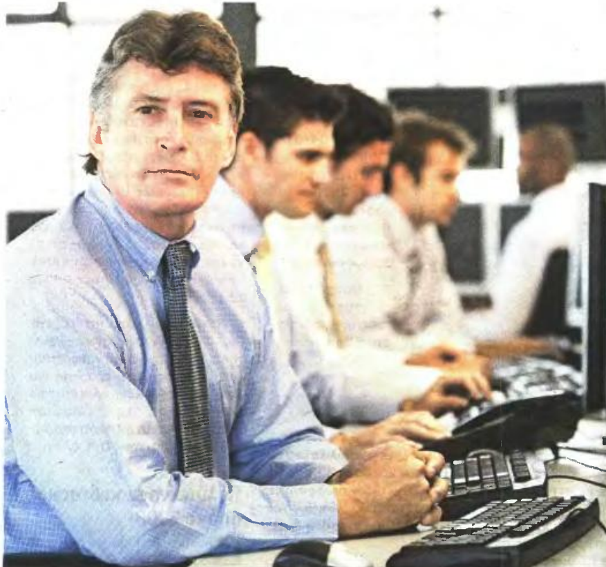
ΤΑ ΝΕΑ ΟΡΙΑ ΗΛΙΚΙΑΣ ΓΙΑ ΤΗΝ ΠΛΗΡΗ ΣΥΝΤΑΞΗ ΑΠΟ ΤΗ ΔΗΜΟΣΙΕΥΣΗ ΤΟΥ ΝΟΜΟΥ ΕΩΣ 31-12-2015