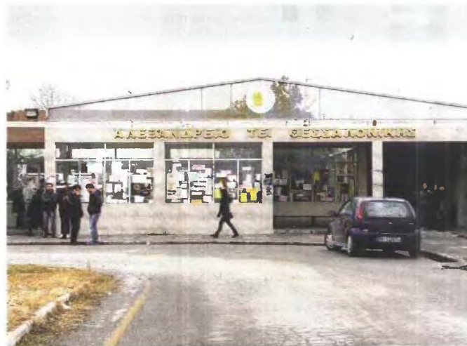
Λίγοι σε σχέση με το συνολικό αριθμό φοιτητών που έρχονται στη Θεσσαλονίκη κάθε χρόνο είναι αυτοί που μπορούν να μείνουν στις φοιτητικές εστίες των τριών πανεπιστημιακών ιδρυμάτων της πόλης. Στις σπουδαστικές εστίες του ΤΕΙΘ, στη Σίνδο, αναμένονται οι αποφάσεις της διοίκησης για τον τρόπο με τον οποίο θα λειτουργήσουν φέτος.

καθώς η προμήθεια πετρελαίου έχει "μπλοκάρει" στο Ελεγκτικό Συνέδριο, για λόγους που σχετίζονται με τη διαγωνιστική διαδικασία.