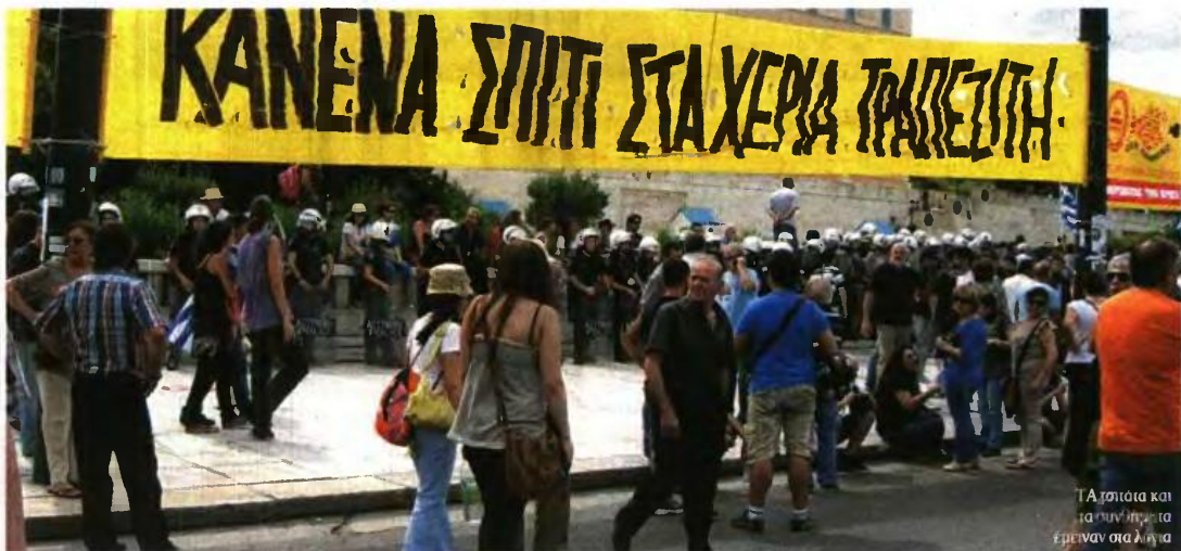
Τα πρώτα και τα επόμενα θα εμπίπτουν στα λίγα

Στο δεύτερο κεφάλαιο του σχεδίου νόμου που αφορά στην τροποποίηση των διατάξεων του νόμου 3869/2010 για την προστασία της πρώτης κατοικίας, όπως σημειώνει η αιτιολογική έκθεση, τίθενται ειδικότεροι όροι και προϋποθέσεις για την προστασία της κύριας ή μοναδικής κατοικίας του οφειλέτη κατά τη διαδικασία ρύθμισης με απαλλαγή από τις οφειλές του. Ο τελευταίος μπορεί έως τις 31 Δεκεμβρίου του 2018 να υποβάλει στο δικαστήριο πρόταση εκκαθάρισης ζητούντας να εξαιρεθεί από την εκποίηση το ακίνητο υπό συγκεκριμένες και σαφείς προϋποθέσεις, δηλαδή το διαθεσίμο οικογενειακό του εισόδημα να μην υπερβαίνει τις εύλογες δαπάνες διαβίωσης, προσαυξημένες κατά 70% και η αντικειμενική αξία της κατοικίας