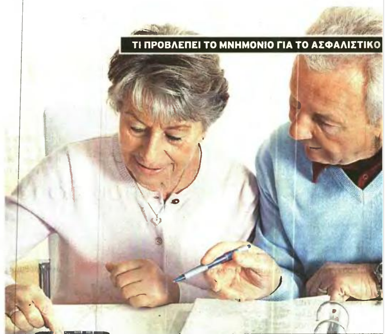
ΤΙ ΠΡΟΒΛΕΠΕΙ ΤΟ ΜΝΗΜΟΝΙΟ ΓΙΑ ΤΟ ΑΣΦΑΛΙΣΤΙΚΟ

Στο πλαίσιο αυτό ο ΣΥΡΙΖΑ επικριρεί να διαμορφώσει τη δική του εναλλακτική πρόταση μεταρρύθμισης του ασφαλιστικού, με σκοπό να ενισχύσει τον κοινωνικό, αναδιανεμητικό ρόλο του συστήματος και τοντάρει -μεταξύ άλλων- στην καταπολέμηση της ανασφάλιστης εργασίας (κάτι που επικαλούνται σχεδόν όλα τα κόμματα). Η ΝΔ κάνει λόγο για τρίπτυχο δράσεων με αύξηση απασχόλησης και μισθών, αλλά και για μάχη κατά της αδήλωσης εργασίας σε συνδυασμό με έξτρα εργαλεία, ενώ δίνει βάρος στις διαρθρωτικές αλλαγές. Το Ποτάμι καρικατίζει το σύστημα άδικο και ελλειμματικό και αναφέρει δέσμη τεσσάρων μέτρων για την αναμόρφωσή του. Το ΠΑΣΟΚ θέλει να προχωρήσουν οι μεταρρυθμίσεις που ξεκίνησαν το 2010 και ζητά εθνικό σχέδιο και συνεννόηση για επενδύσεις, ανάπτυξη, ενίσχυση της απασχόλησης. Το ΚΚΕ και η Λαϊκή Ενότητα στοχεύουν στην ανατροπή των μέτρων που φέρνει το τρίτο Μνημόνιο.