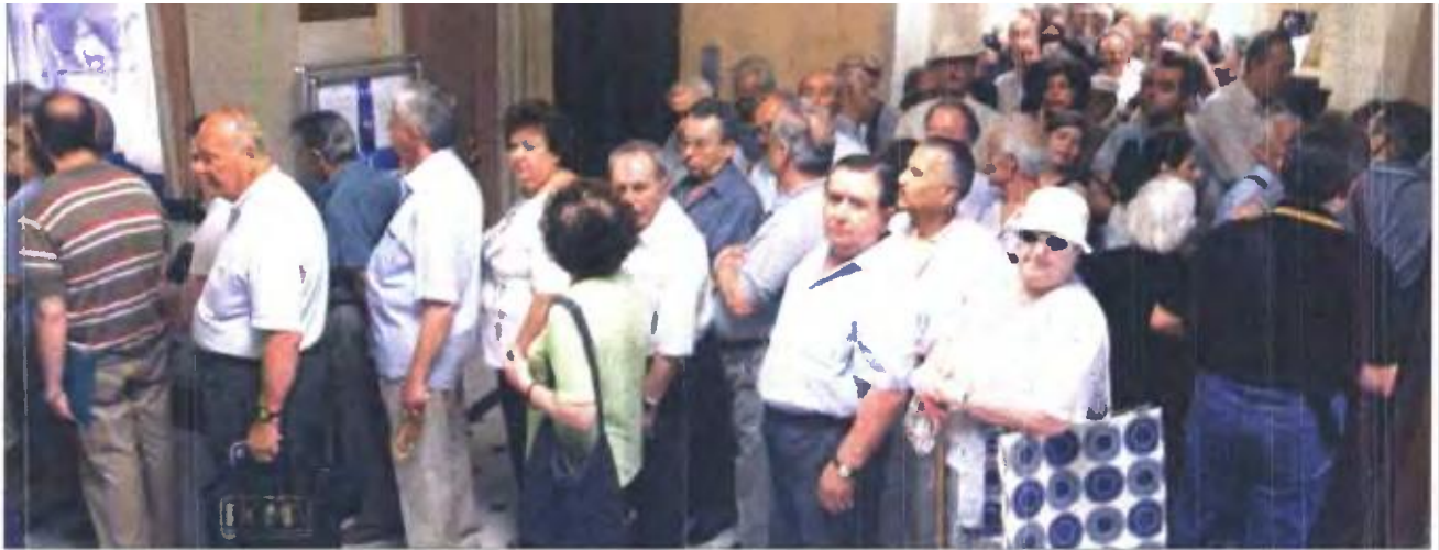
Ουρά συνταξιούχων σε τράπεζα