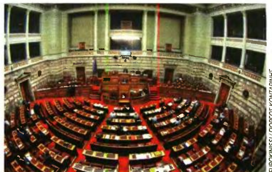
ΕΥΡΟΚΙΝΗΣΗ / ΓΙΑΡΓΟΣ ΚΟΝΤΑΡΙΝΗΣ

συνά μάλιστα με πολιτικό γάμο και με νομική κατοχύρωση των παιδιών), το νομοσχέδιο για το σύμφωνο συμβίωσης είναι το πρώτο ουσιαστικό -αν και μετέωρο- βήμα προς την κατεύθυνση αυτή.