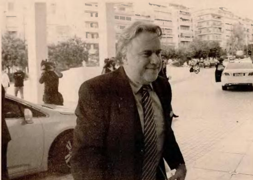
Ο υπουργός Εργασίας, Κοινωνικής Ασφάλισης και Κοινωνικής Αλληλεγγύης Γιώργος Κατρούγκαλος επισήμανε πως δεν μπορούν να γίνουν περικοπές συντάξεων χωρίς να έχει ολοκληρωθεί η ασφαλιστική μεταρρύθμιση.

Αμέσως μετά τη χθεσινή συνάντηση, ο υπουργός Εργασίας, Κοινωνικής Ασφάλισης και Κοινωνικής Αλληλεγγύης Γιώργος Κατρούγκαλος επισήμανε πως δεν μπορούν να γίνουν περικοπές συντάξεων χωρίς να έχει ολοκληρωθεί η ασφαλιστική μεταρρύθμιση που θα οδηγήσει σε ένα δίκαιο και βιώσιμο ασφαλιστικό σύστημα, κάτι με το οποίο δεν φαίνεται να διαφωνούν οι δανειστές. Αυτό βέβαια που ζητούν είναι «αριθμούς» τους οποίους το υπουργείο δεν εμφανίστηκε έτοι-