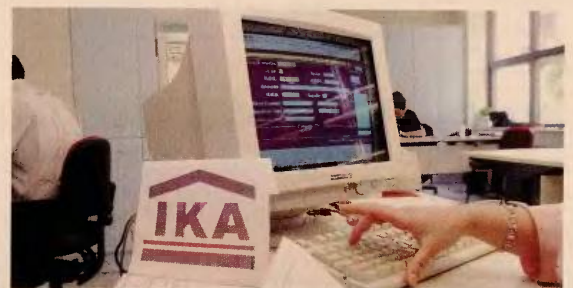
Ο υπουργός Εργασίας Γ. Κατρούγκαλος υποστήριξε πως δεν μπορούν να περικοπούν οι συντάξεις χωρίς να έχει ολοκληρωθεί η ασφαλιστική μεταρρύθμιση.

Ο υπουργός Εργασίας, Κοινωνικής Ασφάλισης και Κοινωνικής Αλληλεγγύης Γιώργος Κατρούγκαλος επεσήμανε πως δεν μπορούν να γίνουν περικοπές συντάξεων χωρίς να έχει ολοκληρωθεί η ασφαλιστική μεταρρύθμιση. Σελ. 18