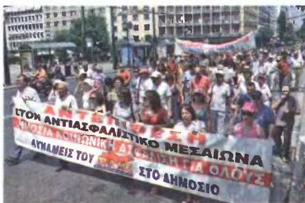
Από παλιότερη κινητοποίηση για το Ασφαλιστικό

Στον αντίποδα, η κατάργηση αυτή θα άνοιγε διάπλατα το δρόμο για την ανάπτυξη των ιδιωτικών ασφαλιστικών συστημάτων, ως πρόσθετη Ασφάλιση προς τη δημόσια, χωρίς βέβαια την εγγύηση του κράτους. Η εξέλιξη, μάλιστα, αυτή είχε σηματοδοτηθεί ακόμα από το 2002, με τη νομοθετική πρόβλεψη για τη δημιουργία Ταμείων Επαγγελματικής Ασφάλισης (νόμος 3029), που εξυπηρετούσε ταυτόχρονα και το γνωστό μοντέλο των «τριών πυλώνων» (βλέπε παρακάτω).