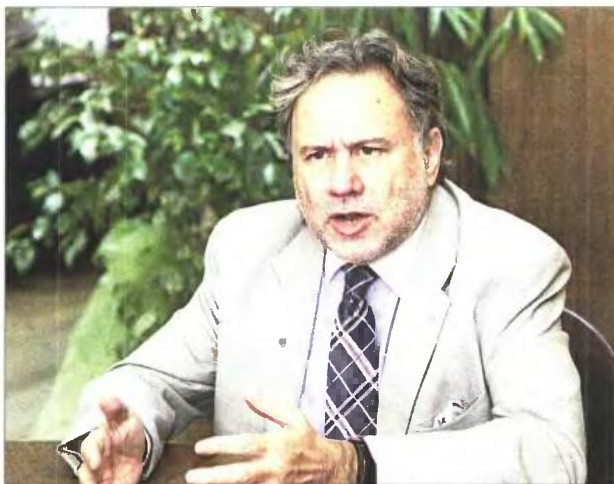
» Ο υπουργός Εργασίας, Κοινωνικής Ασφάλισης και Κοινωνικής Αλληλεγγύης Γ. Κατρούγκαλος

Το σχέδιο υπέβαλε προς έγκριση στον πρωθυπουργό Αλ. Τσίπρα ο υπουργός, ο οποίος διευκρίνισε χθες ότι «κινείται εντός του πλαισίου της συμφωνίας με τους θεσμούς» τόσο σε ό,τι αφορά το Ασφαλιστικό -με δεδομένο το χρονοδιάγραμμα για τη ψηφισιό νέων μέτρων από τον ερχόμενο Οκτώβριο έως και τον Δεκέμβριο του 2015- όσο και σε σχέση με τα βήματα διαβούλευσης που προβλέπονται να γίνουν έως τα τέλη του έτους για τα εργασιακά.