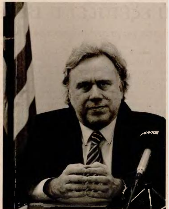
Ο υπουργός Εργασίας Γιώργος Κατρούγκαλος έχει ήδη επεξεργαστεί σχέδιο με τις βασικές αρχές που θα πρέπει να διέπουν το νέο σύστημα και το έχει καταθέσει στον πρωθυπουργό.

Για να αξιοποιηθεί πάντως αυτή η διαφορετική πρόταση, θα πρέπει εντός του χρονοδιαγράμματος που προβλέπει το Μνημόνιο, να συνοδευτεί με μια πλήρως στοιχειοθετημένη αναλογιστική μελέτη, ώστε στη συνέχεια να εγκριθεί από τους εκπροσώπους των θεσμών, να λάβει τη μορφή σχεδίου νόμου και να ψηφιστεί από το ελληνικό κοινοβούλιο, πριν από την αξιολόγηση του Οκτωβρίου. Το εγχείρημα φαντάζει ανεφάρμοστο, με τον κ. Κατρούγκαλο πάντως να δηλώνει χαρακτηριστικά ότι ανεφάρμοστη φαντάζε