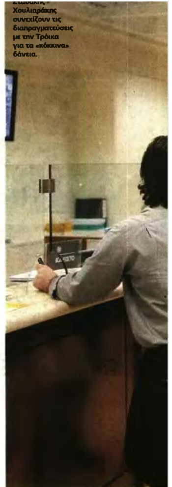
Κυβερνητικοί Χουλιαράκης συνεκίζουν τις διαπραγματεύσεις με την Τρόικα για τα «κόκκινα» δάνεια.

Η προσωρινή προστασία που χορηγείται μέχρι τη συζήτηση της αίτησης, είτε με προσωρινή διαταγή είτε με μόνη της υποβολή της αίτησης είτε με ασφαλιστικά μέτρα, δεν μπορεί να υπερβαίνει το διάστημα των 6 μηνών. Πρακτικά αυτό σημαίνει ότι αίρεται το μέχρι πρότινος καθεστώς της μακροπρόθεσμης προστασίας της πρώτης