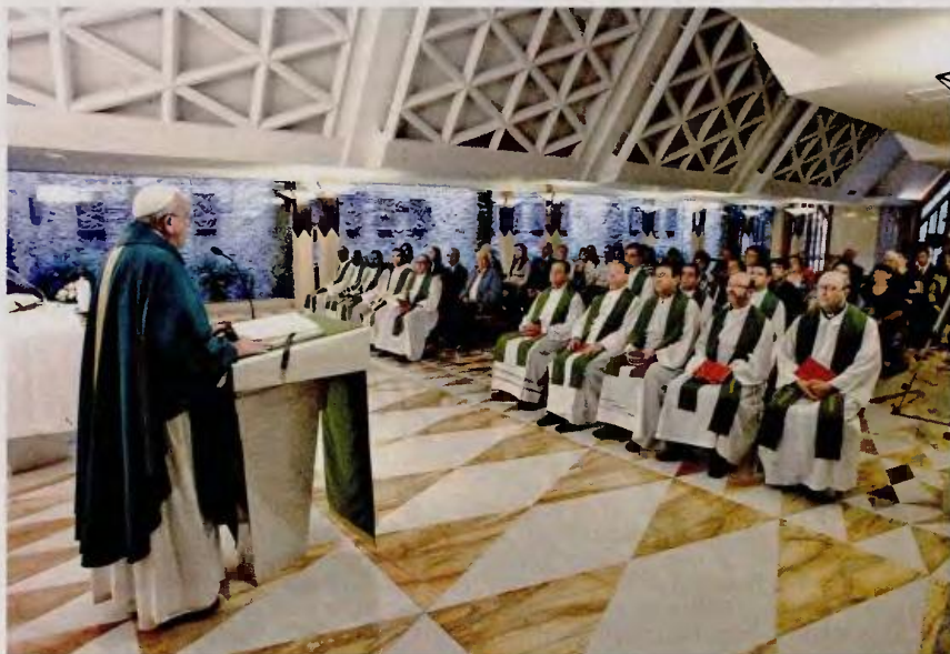
Ο Πάπας Φραγκίσκος ιερουργεί στη Σάντα Μάρτα στο Βατικανό. Η ανεκτικότητα με την οποία αντιμετωπίζει θέματα ταμπού για την Εκκλησία έχει θορυβήσει τους συντηρητικούς κύκλους της ιεραρχίας.

Στη διάρκεια του Ιερού Έτους που αρχίζει στις 8 Δεκεμβρίου