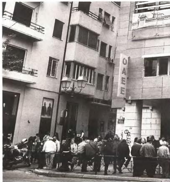
Βόμβα Ρωμανιά ότι στον ΟΑΕΕ δεν διαφαίνεται σωτηρία επειδή τα ελλείμματά του είναι τεράστια.

► Η μέση σύνταξη είναι κάτω από 1.000 ευρώ, που σημαίνει –όπως λένε και αρμόδια στελέχη του– ότι στους περισσότερους συνταξιούχους του ΟΑΕΕ δεν έχει γίνει καμία μείωση, δεδομένου ότι όλες οι περικοπές που επιβλήθηκαν με το Μνημόνιο ξεκινούσαν από ποσά σύνταξης άνω των 1.000 ευρώ. ■