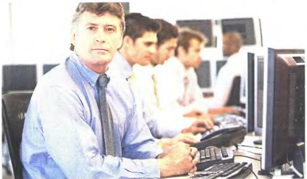
Οι ασφαλισμένοι στα ειδικά ταμεία πριν από το 1983 που συμπληρώνουν 35ετία μπορούν να αποχωρήσουν χωρίς όριο ηλικίας

■ Οι έγγαμες γυναίκες που έχουν προσληφθεί στο Δημό-