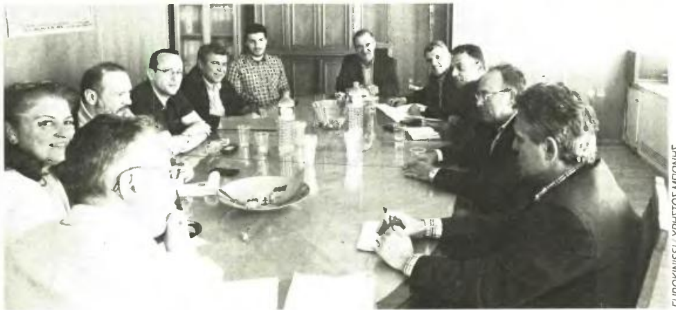
ΕΥΡΟΚΙΝΗΣΗ / ΧΡΗΤΟΣ ΜΠΟΝΗΣ

Ο Δ. Στρατούλης το επιβεβαίωσε σε συνάντησή του με συνδικαλιστές του ΙΚΑ. Τόνισε ότι το Ίδρυμα θα ενισχυθεί σε ανθρώπινο δυναμικό, ενώ ετοιμάζει πακέτο μέτρων για την πάταξη της μαύρης εργασίας και της εισφοροδιαφυγής