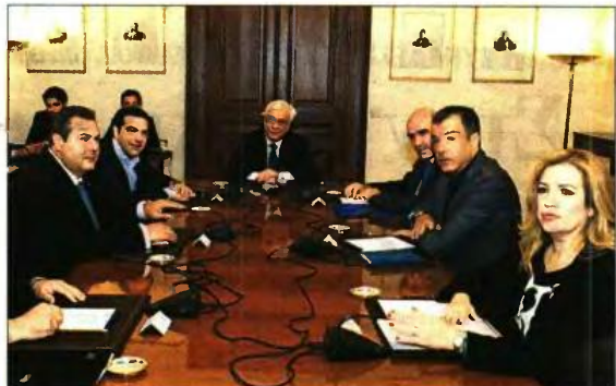
>> Οι κυβερνητικοί εταίροι με τους πολιτικούς αρχηγούς από το προηγούμενο Συμβούλιο Πολιτικών Αρχηγών υπό τον Πρόεδρο της Δημοκρατίας

● Επικρατώντας να εξηγήσουν τις διαδικασίες- εξπρές, πηγές του Μαξίμου εξηγούσαν ότι ενδεδειγμένη μέρα για τη σύγκληση του Συμβουλίου είναι η αυριανή, δεδομένου ότι την Κυριακή ο πρωθυπουργός θα μεταβεί στις Βρυξέλλες για τη Σύνοδο Κορυφής Ε.Ε. - Τουρκίας