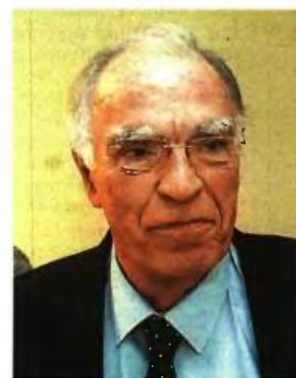
Γ. ΠΛΑΚΙΩΤΑΚΗΣ, Φ. Γεννημάτα, Στ. Θεοδωράκης, Β. Λεβέντης και Π. Καμμένος θα προσέλθουν στη σύσκεψη προκειμένου να ακούσουν την ενημέρωση και τις προτάσεις από τον πρωθυπουργό, αλλά χωρίς να δεσμεύονται για ζητήματα που αφορούν στην άσκηση πολιτικής. Το ΚΚΕ απάντησε αρνητικά και δήλωσε ότι θα αποσεί