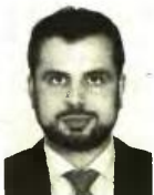
Γράφει ο Διονύσιος Ρίζος

Για το πρώτο δεκαήμερο του νέου έτους φαίνεται να παραπέμπει η κυβέρνηση το σχέδιο νόμου για το νέο Ασφαλιστικό, δίνοντας και μια τροπή «θρίλερ» στη διαπραγμάτευση που θα διεξαχθεί μέχρι το τέλος του έτους ανάμεσα στην πολιτική ηγεσία του υπουργείου Εργασίας και στους «θεσμούς». Αυτό καθώς αναμετρώνται δύο εκ διαμέτρου αντίθετες απόψεις σε σχέση με την κάλυψη της επιπλέον μείωσης της συνταξιοδοτικής δαπάνης. Από τη μία πλευρά η κυβερνητική άποψη, που επιθυμεί να καλυφθεί αυτό το κενό από αύξηση των εισφορών,