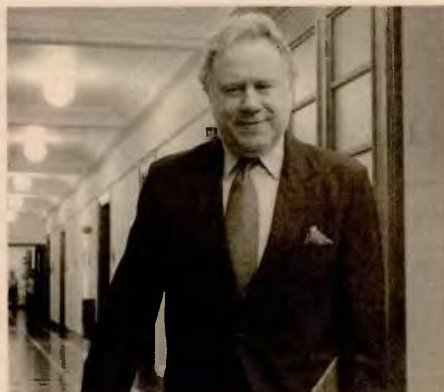
Ο υπουργός Εργασίας και Κοινωνικής Ασφάλισης Γιώργος Κατρούγκαλος.