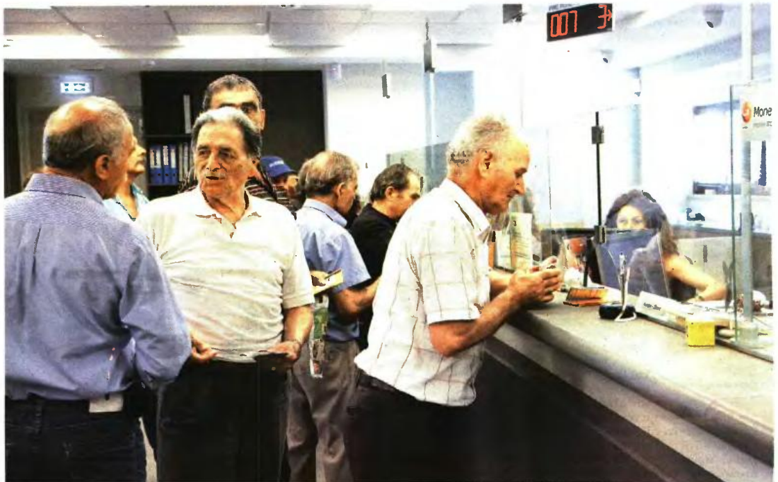
Συνταξιούχοι κατά την πληρωμή των συντάξεων σε τράπεζα. Η κυβέρνηση απορρίπτει κάθε σενάριο οριζόντιων μειώσεων στις κύριες συντάξεις

Οι δανειστές έχουν εκφράσει ενστάσεις για το σχέδιο της αύξησης του μη μισθολογικού κόστους και προκρίνουν τη μείωση των δαπανών μέσω της μείωσης συντάξεων, ενώ θέτουν θέμα και αύξησης των εσόδων από την καταπολέμηση της «μαύρης» εργασίας. Η κυβέρνηση δεν θέλει να αγγίξει τις κύριες συντάξεις και απορρίπτει κάθε σενάριο οριζόντιων μειώσεων. Σκληρή αναμένεται να είναι η μάχη για τις κύριες συντάξεις των σημερινών ασφαλισμένων, καθώς αλλάζει ο τρόπος υπολογισμού.