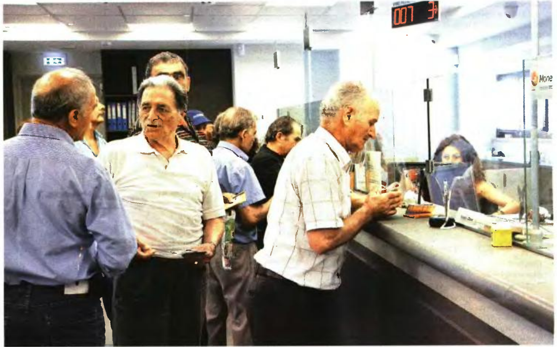
Συνταξιούχοι κατά την πληρωμή των συντάξεων σε τράπεζα. Η κυβέρνηση απορρίπτει κάθε σενάριο οριζόντιων μειώσεων στις κύριες συντάξεις

Οι δανειστές έχουν εκφράσει ενστάσεις για το σχέδιο της αύξησης του μη μισθολογικού κόστους και προκρίνουν τη μείωση των δαπανών μέσω της μείωσης συντάξεων, ενώ θέτουν θέμα και αύξησης των εσόδων από την καταπολέμηση της «μαύρης» εργασίας. Η κυβέρνηση δεν θέλει να αγγίξει τις κύριες συντάξεις και απορρίπτει κάθε σενάριο οριζόντιων μειώσεων. Σκληρή αναμέτρηση να είναι η μάχη για τις κύριες συντάξεις των σημερινών ασφαλισμένων, καθώς αλλάζει ο τρόπος υπολογισμού.