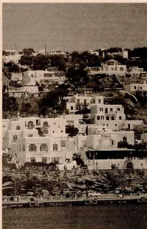
Από την 1η Ιανουαρίου του 2016 θα συνδεθούν οι επιχειρήσεις απευθείας με το σύστημα Taxis - σχεδιάζεται να ξεκινήσει πιλοτικά για συγκεκριμένους κλάδους της αγοράς, όπως είναι η εστίαση, η διαμονή σε ξενοδοχεία κ.ά., αλλά και σε επιτηδευματίες.

5. Σύνδεση ταμειακών μηχανών με το Taxis. Από την 1η Ιανουαρίου του 2016 θα συνδεθούν οι επιχειρήσεις απευθείας με το σύστημα Taxis. Σύμφωνα με πληροφορίες, η σύνδεση των ταμειακών σχεδιάζεται να ξεκινήσει πιλοτικά για συγκεκριμένους κλάδους της αγοράς, όπως είναι η εστίαση, η διαμονή σε ξενοδοχεία κ.ά., αλλά και σε επιτηδευματίες που συγκεντρώνουν υψηλά ποσοστά φοροδιαφυγής, όπως για-