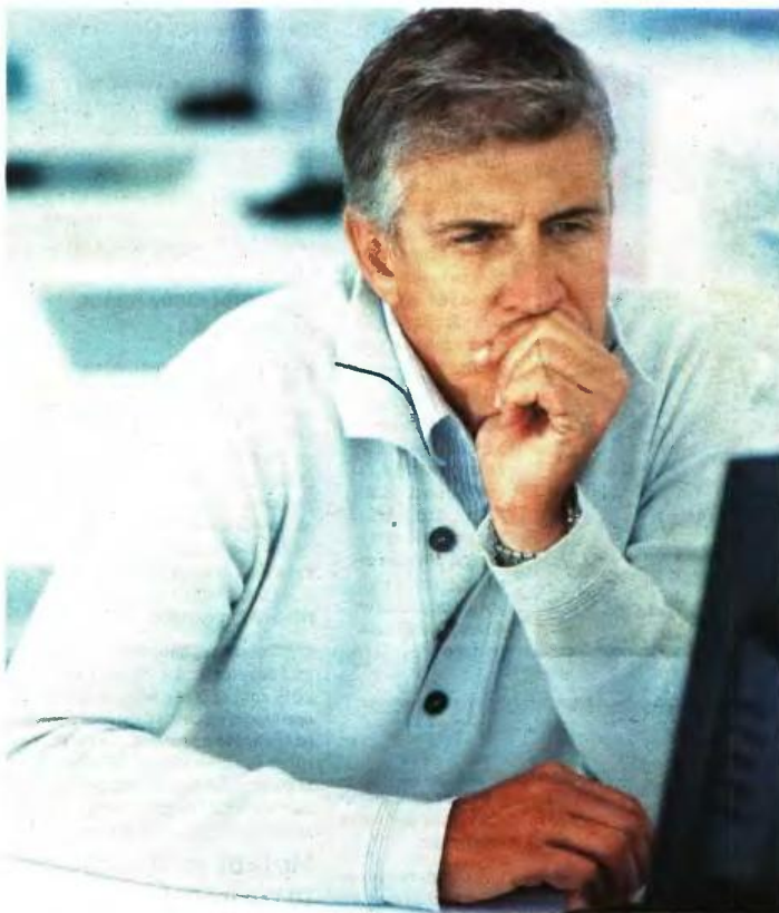
Στους μεγάλους χαμένους οι μητέρες ανηλίκων που είχαν θεμελιώσει δικαίωμα μέχρι το τέλος του 2012, αλλά και οι άντρες με ανήλικα που είχαν 25ετία στο Δημόσιο τη διετία 2011-2012