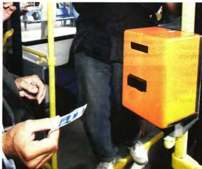
Με «καπέλο» 20% θα πληρώνουν το εισιτήριο του ΟΑΣΘ από το νέο έτος οι επιβάτες του ΟΑΣΘ.

Σε αυτό φαίνεται να καταλήγουν κυβέρνηση και Οργανισμός - Οι νέες τιμές θα ισχύσουν από την αρχή του 2016 - Στόχος να παραμείνουν στα ίδια επίπεδα οι τιμές των καρτών απεριορίστων διαδρομών