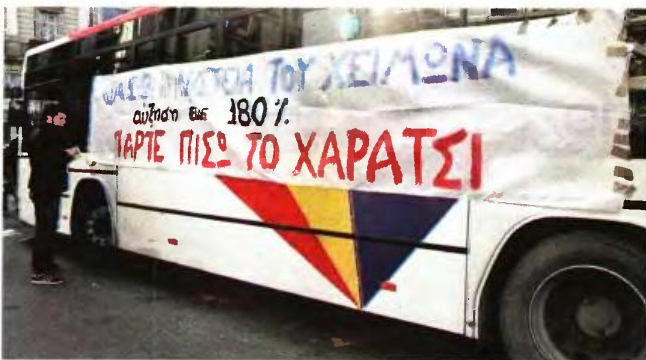
Τον Οκτώβριο του 2014 όταν έγινε η προηγούμενη αύξηση των εισιτηρίων του ΟΑΣΘ και το απλό εισιτήριο πήγε από το 0,80 στο 1 ευρώ, υπήρξαν πολλές αντιδράσεις.

Η προηγούμενη αύξηση των εισιτηρίων του ΟΑΣΘ έγινε την 1η Οκτωβρίου 2014, όταν το απλό εισιτήριο πήγε από το 0,80 στο 1 ευρώ. Η χρονική διάρκεια αυτού του εισιτηρίου μάλιστα μειώθηκε από 90 σε 70 λεπτά τής ώρας. Οι μηνιαίες κάρτες διατηρήθηκαν στα 30 ευρώ, οι τριμηνιαίες μειώθηκαν από 86 στα 84 ευρώ, θεσπίστηκαν πρώτη φορά εξαμηνιαίες κάρτες με κόμιστρο 150 ευρώ και η ετήσια κάρτα μειώθηκε από τα 320 στα 270 ευρώ. Επίσης τον Ιανουάριο του 2011 είχε γίνει αύξηση του εισιτηρίου, με το βασικό να διαμορφώνεται από τα 60 στα 80 λεπτά (33,33%), ενώ το Μάιο του 2010 αυξήθηκε από τα 50 στα 60 λεπτά.