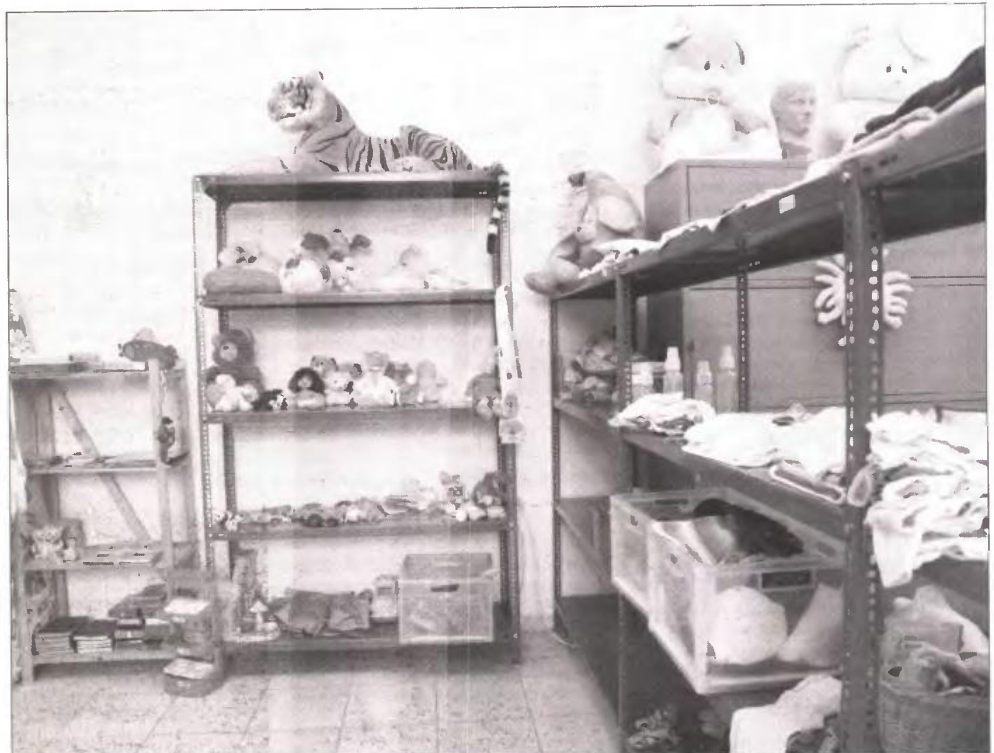
Όσο περνάει ο καιρός, τόσο αυξάνονται οι αιτήσεις στην Πρόνοια και κατ' επέκταση οι δικαιούχοι των καρτών που απευθύνονται στο Κοινωνικό Παντοπωλείο για να προμηθευτούν τα απολύτως απαραίτητα

Μόνη «πελάτης» του Κοινωνικού Παντοπωλείου, είναι όμως και επαγγελματίες που