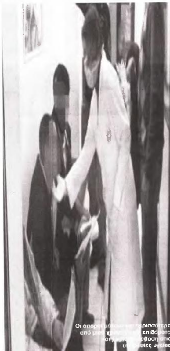
Οι άποροι μόνον χωρίς επιδόματα από μισό χρόνο. Η νέα επιδόματα αιτώνται με καθυστέρηση στις υπηρεσίες υγείας