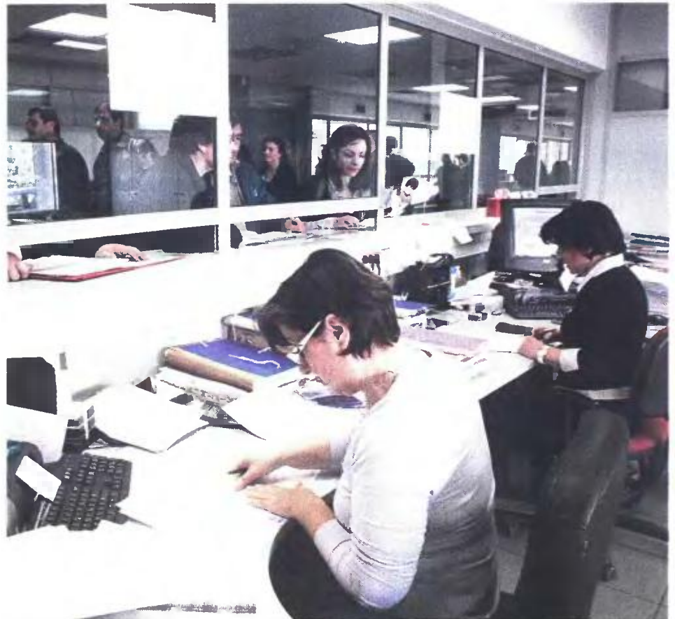
Η επιβολή capital controls προκάλεσε πλήρη κατάρρευση των φορολογικών εσόδων, αφού σχεδόν κανείς δεν πλήρωσε φόρο στο τέλος του προηγούμενου μήνα.

ΜΕΙΩΜΕΝΕΣ ΚΑΤΑ 4 ΔΙΣ. ΕΥΡΩ ΚΑΙ ΟΙ ΔΑΠΑΝΕΣ. ΚΑΘΑΡΑ «ΛΟΓΙΣΤΙΚΟ» ΠΡΩΤΟΓΕΝΕΣ ΠΛΕΟΝΑΣΜΑ 1,9 ΔΙΣ. ΕΥΡΩ ΚΑΤΑΓΡΑΦΕΙ ΤΟ ΠΡΩΤΟ 6ΜΗΝΟ ΤΟΥ 2015 Ο ΠΡΟΥΠΟΛΟΓΙΣΜΟΣ