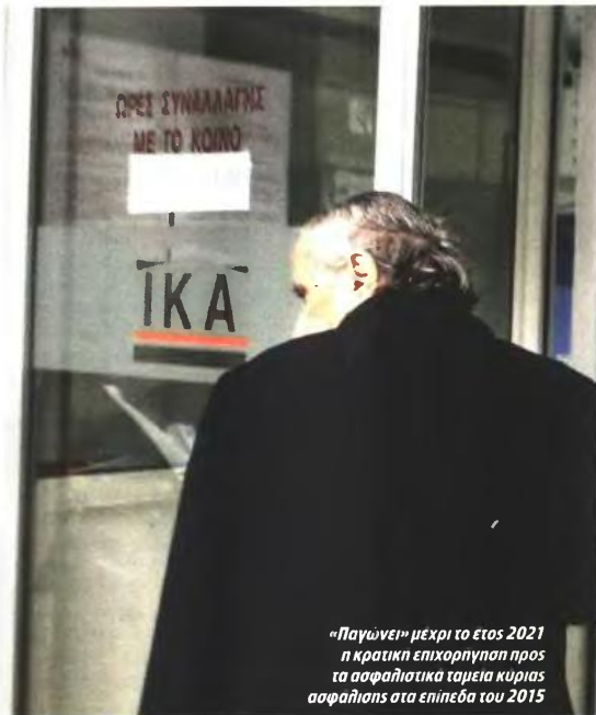
«Παγώνει» μέχρι το έτος 2021 η κρατική επικουρήσεως προς τα ασφαλιστικά ταμεία κυρίας ασφαλίσις στα επίπεδα του 2015

Οι αναγνώστες θα πρέπει να γνωρίζουν ότι δεν είναι αυτές οι μόνες αλλαγές, αφού η κυβέρνηση δεσμεύτηκε, τόσο διά του πρωθυπουργού όσο και με το παρόν νομοσχέδιο που αναμένεται να τύχει ευρείας βουλευτικής αποδοχής (με τη σύμπραξη των κομμάτων ΠΑΣΟΚ-Ν.Δ.-ΠΟΤΑ-ΜΙ και μέρος των βουλευτών του ΣΥΡΙΖΑ), να αναμορφώσει πλήρως το ασφαλιστικό σύστημα (με την αύξηση των εισφορών και τη μείωση των παροχών να δεσπούν στην προμετωπίδα των ριζικών αλλαγών) μέχρι το τέλος του 2015 ώστε οι περισσότερες αλλαγές να ισχύσουν από την 1η