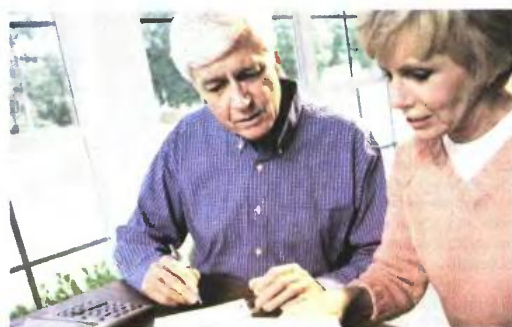
▲ Η ΠΑΡΑΚΡΑΤΗΣΗ για ιατροφαρμακευτική περιθαλψη επιβάλλεται σε όλες τις συντάξεις

Εμμεσες μειώσεις σε κύριες και επικουρικές συντάξεις φέρνουν οι νέες εισφορές για ιατροφαρμακευτική περιθαλψη που εισάγει το νομοσχέδιο με τα προαποτιμωμένα της συμφωνίας. Οι εισφορές αυξάνονται κατά 2 ποσοστιαίες μονάδες στις κύριες συντάξεις (από 4% σε 6%) και κατά έξι μονάδες στις επικουρικές (από 0 σε 6%).