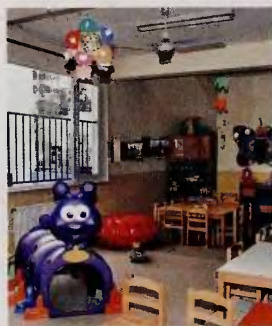
Οι αιτήσεις για δωρεάν φιλοξενία σε παιδικούς σταθμούς έχουν αυξηθεί σημαντικά.

μέχρι το 70% των θέσέων του. «Αυτός ο περιορισμός», υπογραμμίζει ο κ. Πατούλης, «οδήγησε πέρσι στην προσφορά από τις δομές μόνο 91.656 θέσεων, έναντι 98.188 θέσεων που προσφέρθηκαν το 2013. Παράλληλα, σε συνδυασμό με την αναμενόμενη αύξηση των αιτήσεων στις 120.000 από 111.279 πέρσι, θα δημιουργηθεί