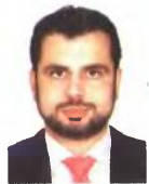
Γράφει ο Διονύσιος Ρίζος

εξάμηνο μέχρι 15 έτη. Ιδιαίτερα χαμένες οι μπότες ασφαλισμένες στο ΙΚΑ που θα λάμβαναν τη σύνταξη με τα κατώτατα όρια συντάξεων, καθώς θα δουν το δικαιούμενο ποσό να μειώνεται μέχρι να συμπληρώσουν το 67ο έτος της ηλικίας τους. Στους χαμένους και οι γονείς στο