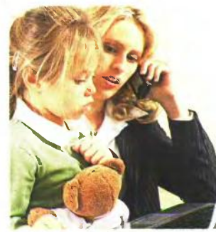
Οι μητέρες ανηλικών θα δουν το όριο να αυξάνεται κατά 6 μήνες τον χρόνο

6 Μητέρες στα Ταμεία των ΔΕΚΟ και των τραπεζών που συμπληρώνουν 25ετία το 2012 και έχουν ανήλικο. Μπορούν να λάβουν σύνταξη σε ηλικία 52 ετών μειωμένη και σε ηλικία 55 ετών πλήρη. Με το νέο πλαίσιο το όριο αυξάνεται κατά έξι μήνες τον χρόνο.