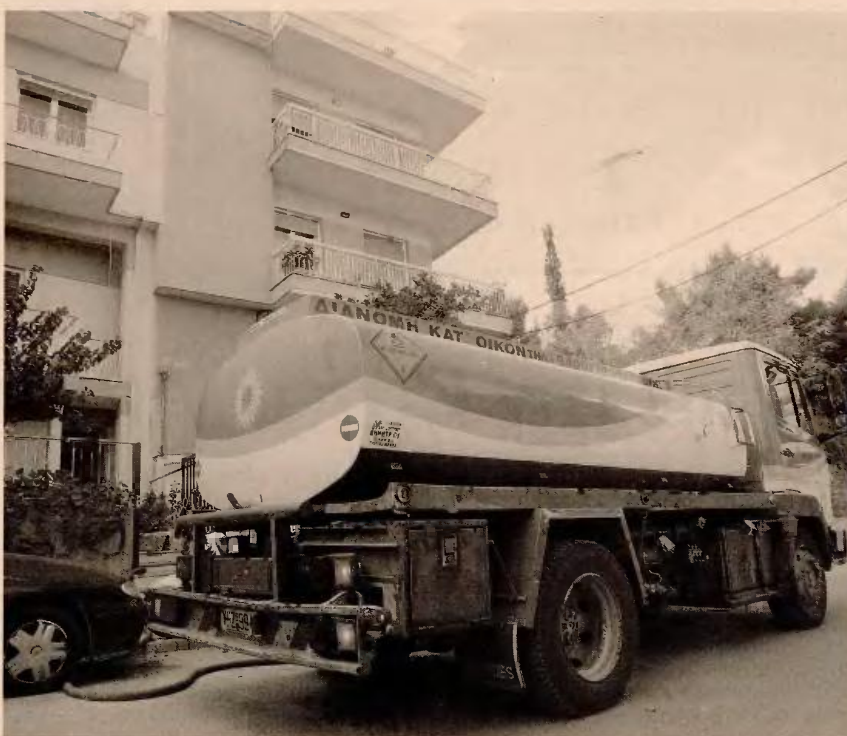
Για τις αιτήσεις που θα κατατεθούν έως τις 31 Δεκεμβρίου 2015 η πληρωμή του επιδόματος θα γίνει μέχρι τις 2 Φεβρουαρίου 2016, ενώ για όσες κατατεθούν από 1ης Ιανουαρίου 2016 έως και τις 30 Μαΐου 2016, η πληρωμή θα γίνει μέχρι τις 30 Ιουνίου 2016.

Περισσότερες από 180.000 αιτήσεις έχουν υποβληθεί στο ηλεκτρονικό σύστημα του υπουργείου Οικονομικών για τη χορήγηση του επιδόματος θέρμανσης, ωστόσο τα 2/3 εξ αυτών έχουν απορριφθεί. Και αυτό καθώς τα νοικοκυριά που υπέβαλαν τις αιτήσεις προφανώς δεν είχαν ενημερωθεί για το «ψαλίδισμα» του ποσού (από τα 210 εκατ. ευρώ στα 105 εκατ. ευρώ) και κατ' επέκταση τη μείωση του αριθμού των δικαιούχων. Σημειώνεται ότι για τις αιτήσεις που θα κατατεθούν (μέσω Taxisnet) έως τις 31 Δεκεμβρίου 2015 η πληρωμή θα γίνει μέχρι τις 2 Φεβρουαρίου 2016. Για αιτήσεις που θα κατατεθούν από 1ης Ιανουαρίου 2016 έως και τις 30 Μαΐου 2016, η πληρωμή θα γίνει μέχρι τις 30 Ιουνίου 2016. Το διάστημα χορήγησης του επιδόματος θα είναι για αγορές από 15 Οκτωβρίου 2015 μέχρι και την 30η Απριλίου 2016, κατόπιν σχετικής αίτησης που υποβάλλεται το αργότερο μέχρι τις 30 Μαΐου 2016. Η Διεύθυνση Ηλεκτρονικής Διακυβέρνησης της Γενικής Γραμματείας Δημοσίων Εσόδων (ΓΓΔΕ) έδωσε στη δημοσιότητα και έναν οδηγό με απαντήσεις στα συνηθέστερα ερωτήματα των χρηστών προκειμένου να γνωρίζουν οι ενδιαφερόμενοι πού πρέπει να υποβληθεί η αίτηση, καθώς και τι πρέπει να κάνουν οι διαχειριστές πολυκατοικιών.