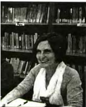
Παρουσίαση της δράσης

Η δράση ξεκίνησε από τους καθηγητές, την αγκάλιασαν η κοινωνία και οι φορείς και εντάχθηκε στο επίσημο πρόγραμμα των εορταστικών εκδηλώσεων. Και -το σημαντικότερο- αδιαμφισβήτητα αποτελεί την γιορτή που απαντά με μια δυνατή φωνή και δηλώνει ότι η τοπική κοινωνία είναι παρούσα, βοηθά και στηρίζει τις δράσεις αλληλεγγύης στον συνάνθρωπο.