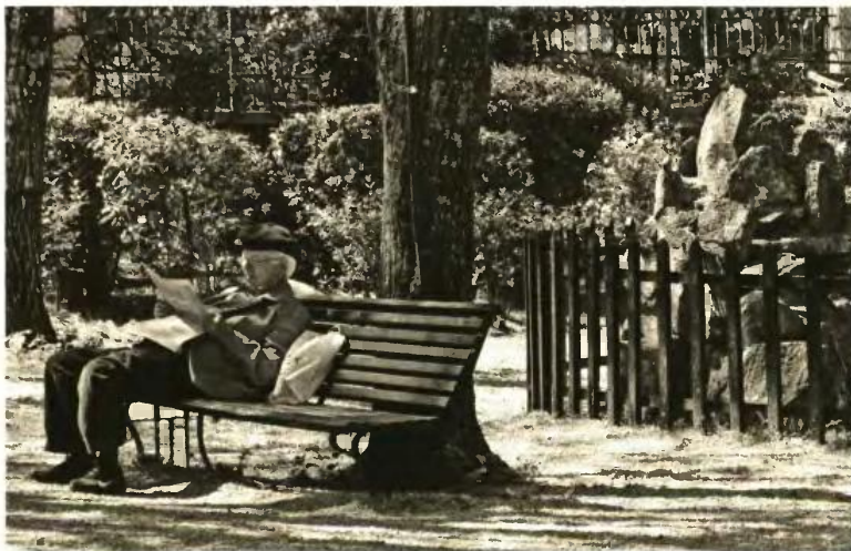
ΕΥΡΩΚΙΝΗΣΗ / ΧΑΤΣΙΑΝΗΣ ΒΑΙΟΣ

Χτες το πρωί κατά την καθημερινή σύσκεψη στο Μαξίμου φαίνεται να επικράτησε προβληματισμός για τη διαδικασία που ακολουθήθηκε με το νομοσχέδιο του «παράλληλου προγράμμα-