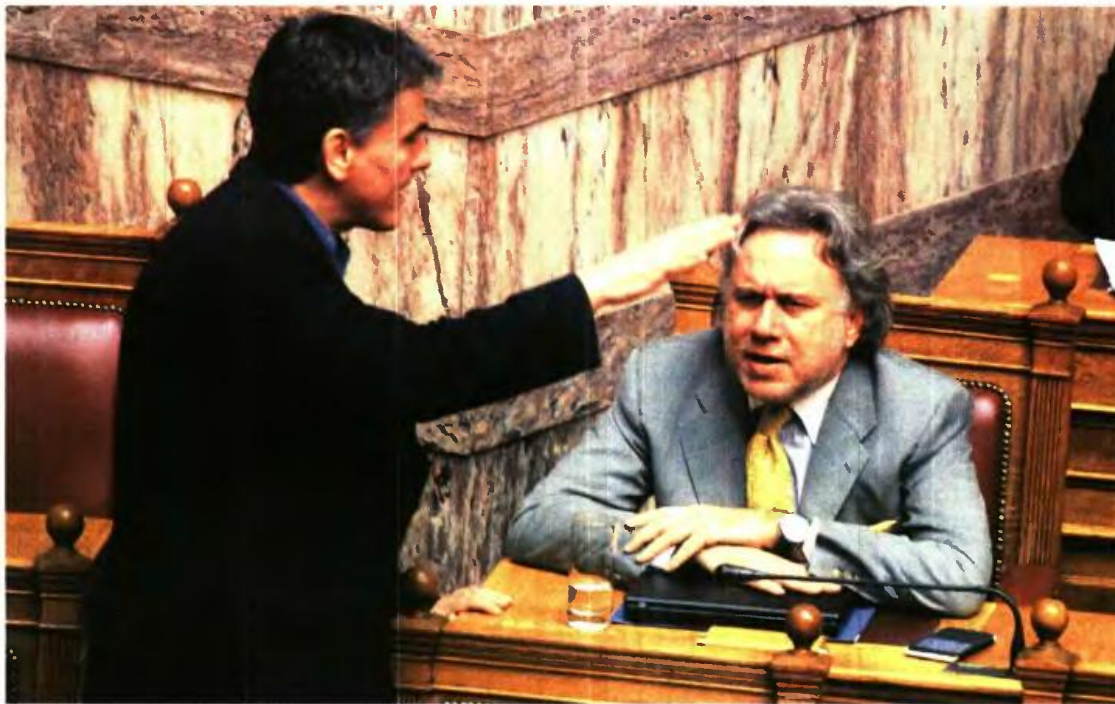
ΤΟ ΣΧΕΔΙΟ ΝΟΜΟΥ

Ο ΥΠΟΥΡΓΟΣ Οικονομικών Ευ. Τσκαλώτος με τον υπουργό Εργασίας Γ. Κατρούγκαλο, στον οποίο το Μέγαρο Μαξίμου έχει διαμηνύσει ότι μέχρι τις 15 Ιανουαρίου πρέπει να έχει ψηφιστεί το σχέδιο νόμου για τις αλλαγές στο Ασφαλιστικό