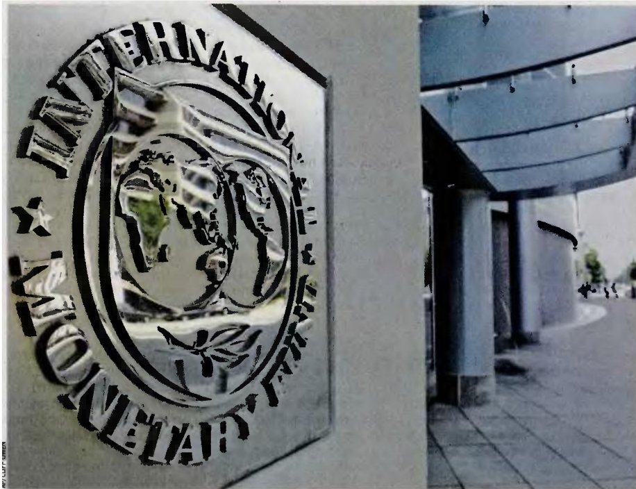
Το Διεθνές Νομισματικό Ταμείο πιέζει, σύμφωνα με πληροφορίες, για υιοθέτηση νέων μέτρων για την κάλυψη και αυτών των «κενών» που ενδεχομένως να δημιουργηθούν.