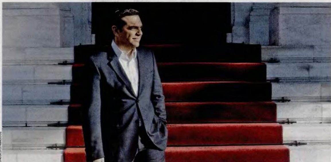
Ο πρωθυπουργός Αλ. Τσίπρας συναντήθηκε και συνομίλησε χθες το βράδυ με βουλευτές της Δυτικής Μακεδονίας.

Σημάδια αισιοδοξίας για τη συγκρότηση μετώπου εναντίον των πολιτικών λιτότητας στην Ευρώπη διακρίνουν οι συνεργάτες του πρωθυπουργού στο αποτέλεσμα των εκλογών της Κυριακής στην Ισπανία. Στο επελείο του κ. Αλ. Τσίπρα καταλήγουν σε τρία συμπεράσματα αναφορικά με τις εκλογές της Κυριακής. Το πρώτο εντοπίζεται σε αυτό που περιγράφουν ως «ήττα της λιτότητας». Όπως λένε, το κόμμα του Μαριάνο Ραχόι ήταν ο κύριος πολιτικός φορέας επιβολής πολιτικών λιτότητας στην Ισπανία και η απώλεια του 1/3 της ισχύος του κατά τις προχθεσινές εκλογές μπορεί να ερμηνευθεί μόνο ως ήττα των περιοριστικών πολιτικών. Το δεύτερο θετικό στοιχείο το οποίο αναδεικνύουν οι επιτελείς του Μεγάρου Μαξίμου είναι η προοπτική δημιουργίας συνθηκών για τη συγκρότηση κυβέρνησης με προοδευτική κατεύθυνση. Αν στην Ισπανία συγκροτηθεί κυβέρνηση Κεντροαριστεράς - Αριστεράς, θα είναι η τρίτη στην Ευρώπη, έπειτα από την Ελλάδα και την Πορτογαλία. Σύμφωνα με το τρίτο επιχείρημα που χρησιμοποιούν οι επιτελείς του κ. Τσίπρα, οι επιδόσεις του Podemos στις ισπανικές εκλογές λειτουργούν ως διάψευση για όσους υποστήριζαν το προηγουμένο χρονικό διάστημα ότι το αριστερό κόμμα θα αποδυναμωνόταν λόγω της εμπειρίας του ΣΥΡΙΖΑ στην Ελλάδα κατά τον τελευταίο χρόνο. Το Podemos, επισημαίνουν, κατόρθωσε να επιτύχει την τρίτη θέση και πάλεψε ακόμη και για τη δεύτερη, γεγονός που το καθιστά μια πολιτική δύναμη με ισχυρή παρουσία και πιθανότητες περαιτέρω μεγέθυνσης στο μέλλον.