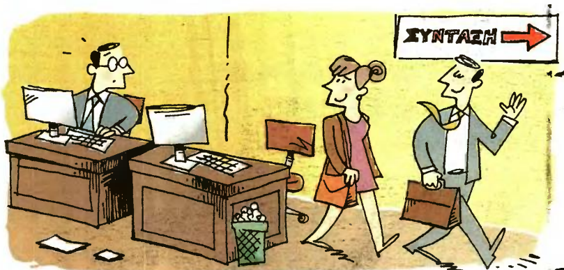
ΕΙΚΟΝΟΓΡΑΦΗΣΗ ΚΩΣΤΑΣ ΣΚΛΑΒΕΝΙΤΗΣ