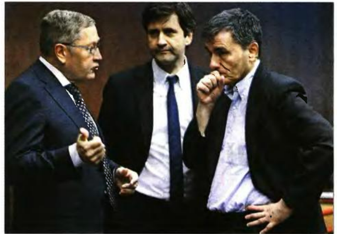
» Κλ. Ρέγκλιγγκ, Γ. Χουλιαράκης και Ευκλ. Τσακαλώτος χθες στο Eurogroup

«Αν μπορούμε να το κάνουμε γρήγορα θα είμαι ευτυχής», δήλωσε, ενώ έκανε λόγο για ανάγκη αποπολιτικοποίησης τόσο στο δημόσιο όσο και στις διοικήσεις των τραπεζών, κάτι