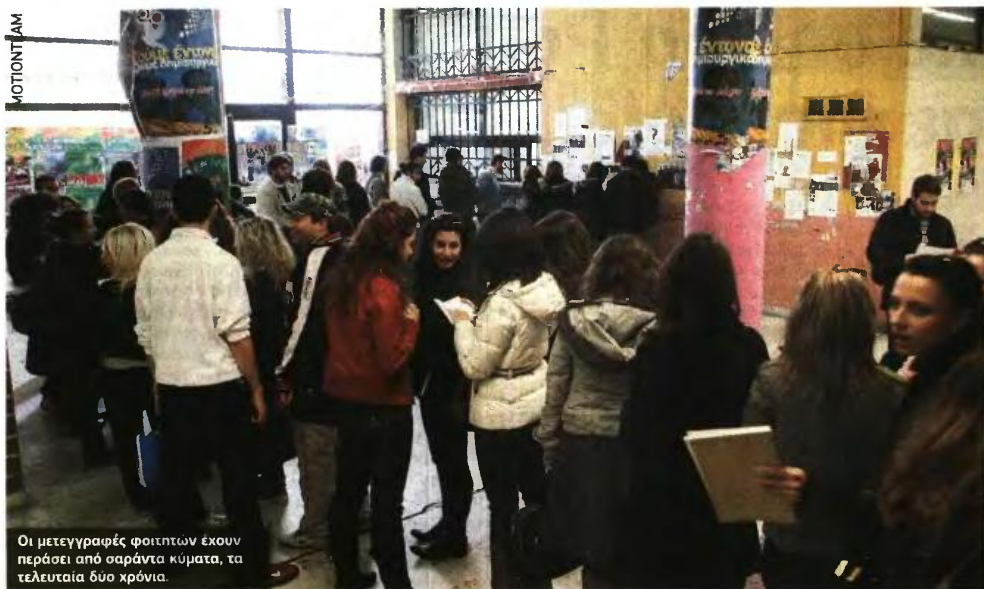
Οι μετεγγραφές φοιτητών έχουν περάσει από σαράντα κύματα, τα τελευταία δύο χρόνια.