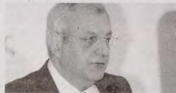
Ο πρόεδρος και διευθύνων σύμβουλος Ν. Χατζηαργυρίου

Σε περίπτωση που τόσο η τετραμηνιαία κατανάλωση ηλεκτρικής ενέργειας Ευάλωτου Πελάτη, όσο και η μέση τετραμηνιαία κατανάλωσή του