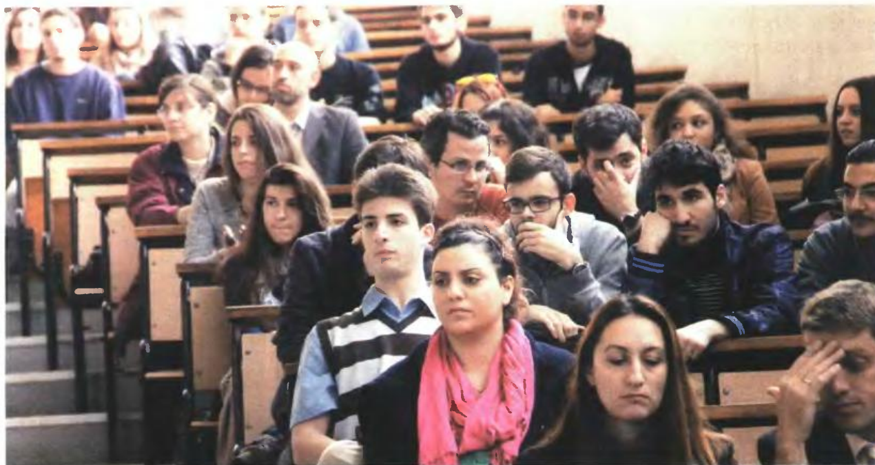
▲ ΟΙ ΝΕΕΣ ΡΥΘΜΙΣΕΙΣ έχουν πολλές καινοτομίες και είναι προσαρμοσμένες στο σκεπτικό της απόφασης του ΣτΕ, που έβαζε «φρένο» στις μετεγγραφές

Με επιπλέον μόρια θα πριμοδοτούνται από το επόμενο ακαδημαϊκό έτος όσοι ανήκουν στις ευπαθείς ομάδες. Δικαίωμα αλλαγής ΑΕΙ θα έχουν και φοιτητές προηγούμενων ετών και όχι μόνον οι πρωτοετείς