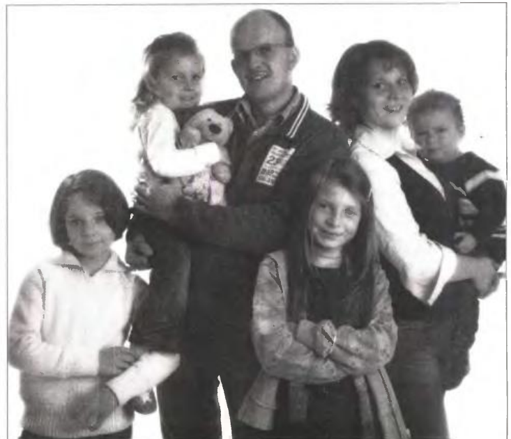
Διάχυτη απογοήτευση σε πολλές πολύτεκνες οικογένειες