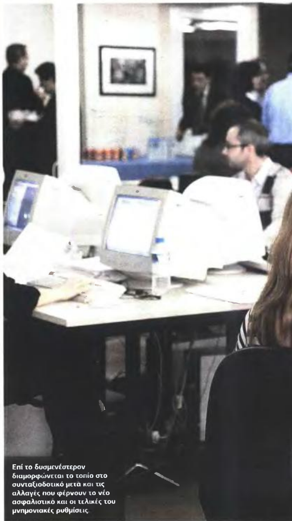
Επί το δυσμενέστερον διαμορφώνεται το τοπίο στο συνταξιοδοτικό μετά και τις αλλαγές που φέρνουν το νέο ασφαλιστικό και οι τελικές του μνημονιακές ρυθμίσεις

5 Υπάρχει υπέρμετρη επιβάρυνση στα όρια ηλικίας για τις τρίτεκνες μητέρες από Δημόσιο, ΔΕΚΟ και τράπεζες, καθώς η έξοδος χωρίς όριο ηλικίας με μόλις 20 έτη ως το 2010 καταργείται. Για να διασω-