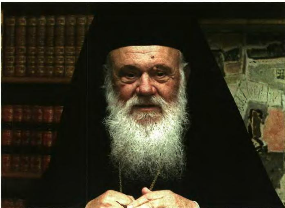
Λάβρος ο Αρχιεπίσκοπος Ιερώνυμος κατά την επίσκεψή του στο Βερολίνο για τις ευθύνες της Ε.Ε. στο προσφυγικό.

Τον Αρχιεπίσκοπο και τη συνοδεία του καλωσόρισε στο Μόναχο ο διευ-