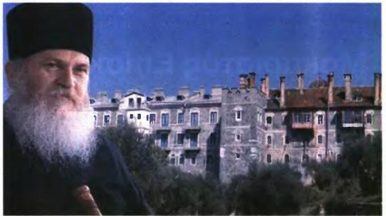
ιστορικές περιόδους ζωής της μονής.

Κάτω από την καθοδήγηση του Γέροντα Εφραίμ σχεδιάστηκε και υλοποιήθηκε η ανέγερση του κτηρίου φιλοξενίας, κτηρίων που διαμένουν οι λιμενικοί, οι αστυνομικοί, οι συντηρητές του υπουργείου Πολιτισμού, οι εργάτες, ενώ λειτουργεί το μαγειρείο, η τράπεζα, το ελαιοτριβείο. Παράλληλα, ολοκληρώνεται το σύστημα αποχετεύσεως και βιολογικού καθαρισμού και εξελίσσεται το έργο διαφυλάξεως των κειμηλίων και της διδακτικής εκθέσεως που θα περιλαμβάνει κειμήλια με βάση τις