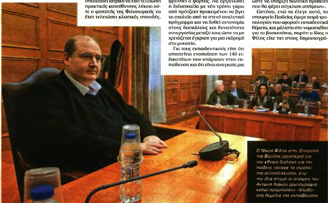
Ο Νίκος Φίλης στην Επιτροπή της Βουλής (αριστερά) για τον εθνικό διάλογο για την παιδεία «αναψε τα αιμάτα» της αντιπολίτευσης, ενώ την ίδια στιγμή οι απόψεις του Αντώνη Λιάκου (φωτογραφία κάτω) προηγήθηκαν «βόμβα» στα θεμέλια της εκπαίδευσης

«Τελικά ο διάλογος για την παιδεία πήγε περίπατο στις βουκόσιμες γαίες (!)» είπε ο Γιώργος Μαυρωτάς από Το Ποτάμι.