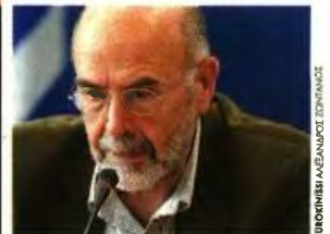
ΕΠΙΧΡΗΣΗ ΑΓΝΩΣΤΟΥ ΕΣΤΙΝΑΝ