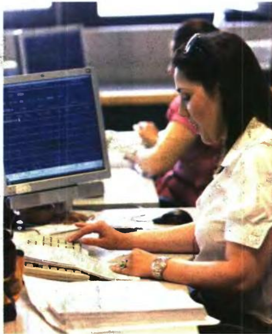
ΟΙ ΑΛΛΑΓΕΣ στο έντυπο του «πόθεν έσχες» θεωρούνται προάγγελος του νέου ηλεκτρονικού περιουσιολογίου που ετοιμάζει το υπουργείο Οικονομικών για όλους τους φορολογούμενους

■ Ο υπόχρεος υποβολής δήλωσης περιουσιακής κατάστασης (ΔΠΚ) απαιτείται να είναι ενεργός χρή-