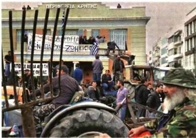
Τρακτέρ μπροστά στην Περιφέρεια (πάνω) και πέρις του Παγκρήτιου (κάτω)

Ωστόσο, όπως σε κάθε τόνο επισημαίνουν, δεν έχουν σκοπό να στήσουν μπλόκα σε δρόμους του νησιού, ενώ μόνο για λίγα λεπτά έκλεισε συμβολικό ο κόμβος των