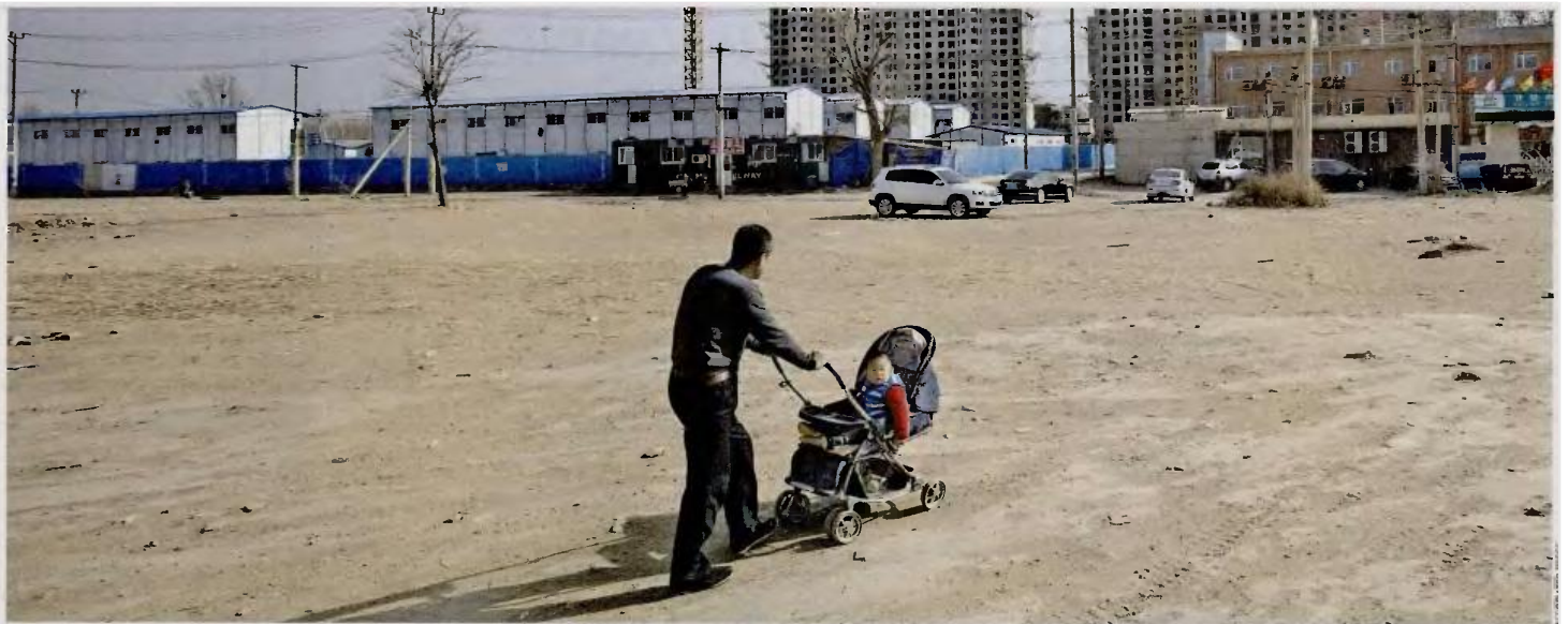
Η πολιτική του ενός παιδιού στην Κίνα φαίνεται ότι τελικά στέρησε τη χώρα από τα εργατικά χέρια που θα μπορούσαν να επωμισθούν τη συχνά φρενήρη ανάπτυξη της.