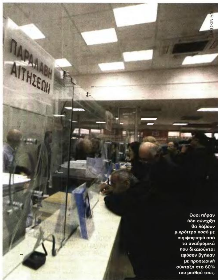
Όσοι πήραν ήδη σύνταξη θα λάβουν μικρότερο ποσό με συμψηφισμό από τα αναδρομικά που δικαιούνται εφόσον βγήκαν με προσωρινή σύνταξη στο 60% του μισθού τους.

1 Θεμελίωση μέχρι 31/12/2014 (ηλικία αποχώρησης και έτη ασφάλισης συμπληρωμένα κατά την 31/12/2014) και αίτηση συνταξιο-