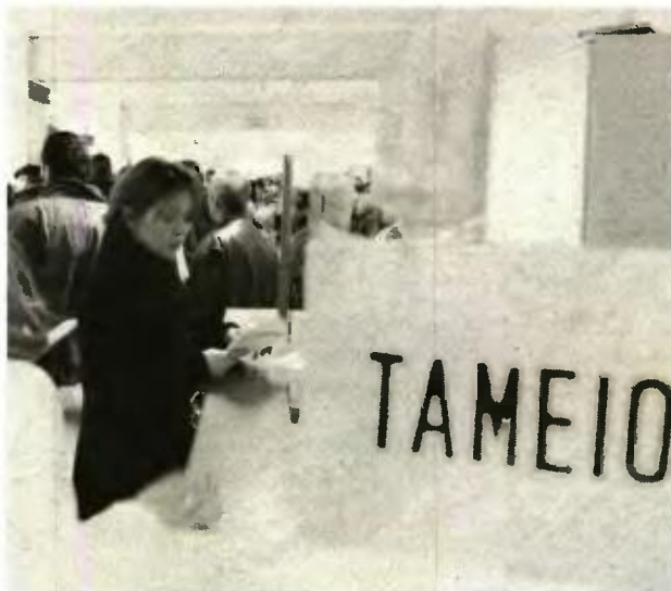
Το κονδύλι που πρόκειται να πιστωθεί στους δικαιούχους είναι 225 εκατ. ευρώ και αφορά τη γ' δόση των οικογενειακών επιδομάτων

Η Κυβέρνηση με νεότερες ανακοινώσεις είχε επισημάνει ότι επρόκειτο να γίνει η κατάθεση των χρημάτων στα τέλη της προηγούμενης εβδομάδας ή το αργότερο στις αρχές της εβδομάδας που ήδη διανύουμε. Χθες με νεότερη ανακοίνωσή του ο ΟΓΑ