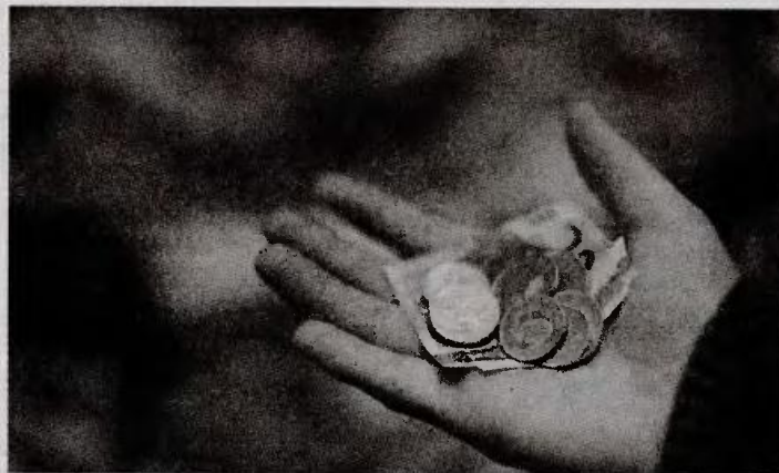
Από τις αρχές του 2015, έως τις 23 Ιουνίου, οι θάνατοι ανήλθαν στους 61.308 και οι γεννήσεις μόλις στους 41.513

«Φόρο πολυτελούς διαβίωσης στα ποσά της ετήσιας αντικειμενικής δαπάνης που προκύπτουν από την κυριότητα ή κατοχή επιβατικών αυτοκινήτων ιδιωτικής χρήσης μεγάλου κυβισμού. Για αυτοκίνητα από 1.929 έως 2.500 κυβικά εκατοστά ο φόρος ισούται με το γινόμενο του ποσού της ετήσιας αντικειμενικής δαπάνης επί συντελεστή πέντε τοις εκατό (5%)». Στη συνέχεια, με τη διάταξη του άρθρου 31 παρ. 1 περ. γ' του ν. 4172/2013 καθόρισε ότι: «... γ) η ετήσια αντικειμενική δαπάνη επιβατικού αυτοκινήτου ιδιωτικής χρήσης ορίζεται ως εξής: αα) Για τα αυτοκίνητα μέχρι χίλια διακόσια (1.200) κυβικά εκατοστά τέσσερις χιλιάδες (4.000) ευρώ. ββ) Για αυτοκίνητα μεγαλύτερα των 1.200 κυβικών εκατοστών προστίθενται εξακόσια (600) ευρώ ανά εκατό (100) κυβικά εκατοστά μέχρι τα δύο χιλιάδες (2.000) κυβικά εκατοστά. γγ) Για αυτοκίνητα των δύο χιλιάδων (2.000) κυβικών εκατοστών προστίθενται εννιάκοσια (900) ευρώ ανά εκατό (100) κυβικά εκατοστά και μέχρι τρεις χιλιάδες (3.000) κυβικά εκατοστά». Οι πολυτέ-