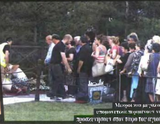
Μιστοί για με γάιο υπομονετικά περιμένουν να προσκίνησουν στον τάφο του αγίου