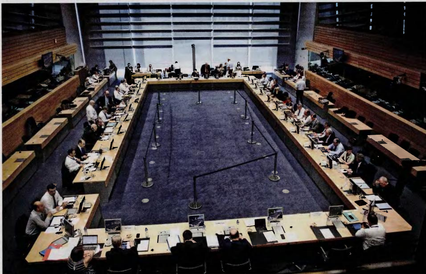
Στιγμιότυπο από τη δεύτερη ημέρα της κρίσιμης συνεδρίασης του Eurogroup που πραγματοποιήθηκε χθες στις Βρυξέλλες.