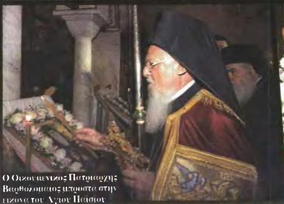
Ο Οικουμενικός Πατριάρχης Βαρθολομαίος μπουσά στην είσοδο του Αγίου Παΐσιου

Μπουσά στον τάφο του Αγιορείτη μοναχού χιλιάδες πιστοί προσκίνησαν με τη σκέψη στις δύσκολες ώρες που περνά η πατριδα