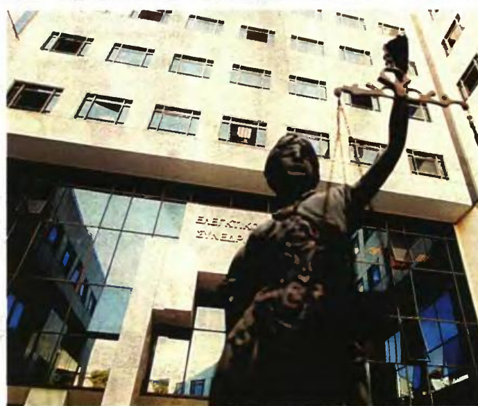
Δ ΣΤΗΝ ΤΕΛΕΥΤΑΙΑ ΓΝΩΜΟΔΟΤΗΣΗ για το πολυνομοσχέδιο που μόλις ψηφίστηκε, η Ολομέλεια ΕΣ έκρουσε πάλι τον κώδωνα του κινδύνου ότι κάποιες από τις νέες ρυθμίσεις στις συντάξεις μπορεί να εγείρουν προβλήματα συνταγματικότητας

εφαρμογή των νέων συνταξιοδοτικών ρυθμίσεων μπορεί να δημιουργηθούν ερμηνευτικά προβλήματα, εάν ο νομοθέτης δίνει διαφορετική έννοια στο ποιο θεμελιώνουν συνταξιοδοτικά δικαιώματα.