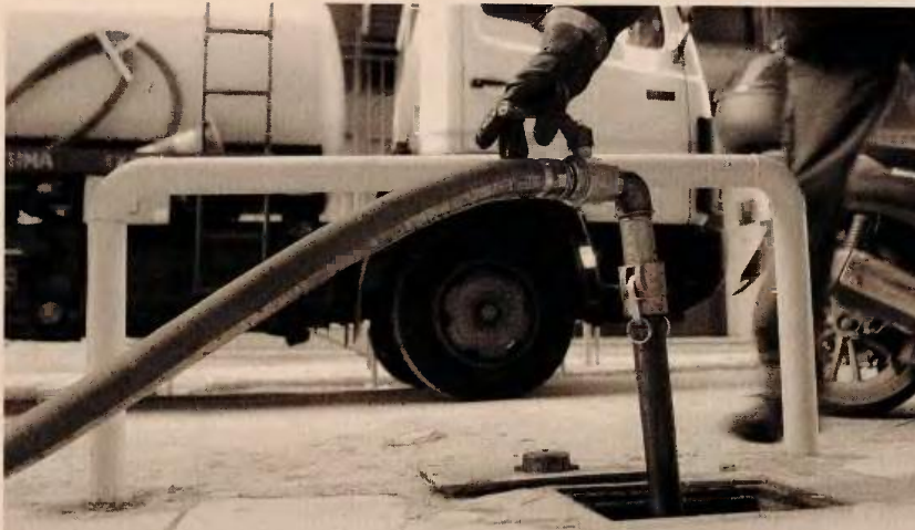
Το κόστος για τους δικαιούχους του επιδόματος θέρμανσης θα κυμανθεί κάτω από τα 60 λεπτά το λίτρο στην Αθήνα και περίπου στα 63-65 λεπτά το λίτρο στην περιφέρεια.

Αρχές του 2016 αναμένεται να κατατεθεί η πρώτη δόση στους λογαριασμούς των δικαιούχων, ενώ η εξόφληση θα γίνει τον Μάιο του 2016.