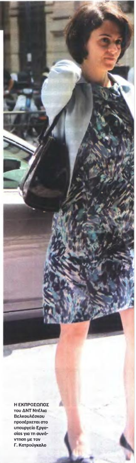
Η ΕΚΠΡΟΣΩΠΟΣ του ΔΝΤ Ντέλια Βελκουλέσκου προσέρχεται στο υπουργείο Εργασίας για τη συνάντηση με τον Γ. Κατρούγκαλο

Η συνολική εξέλιξη των διαπραγματεύσεων θα κρίνει και το πότε θα περάσει η επίμαχη ρύθμιση