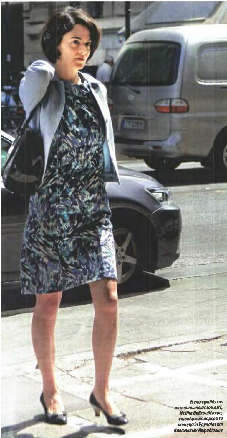
Η επικεφαλής της αντιπροσωπείας του ΔΝΤ, Ντέττα Βεκουλιότου, επισκέφτηκε σήμερα το υπουργείο Εργασίας και Κοινωνικών Ασφαλίσεων

τούνται είτε στα 62 έτη με 40 χρόνια προϋπηρεσίας είτε στα 67 έτη. Με δεδομένη την πολύ υψηλή ανεργία που αφήνει εκτός παραγωγής ένα μεγάλο μέρος του πληθυσμού, οι μεγάλοι «χαμένοι» αυτής της προσαρμογής μακροπρόθεσμα θα είναι οι εργαζόμενοι του ιδιωτικού τομέα, σε σχέση με τους δημόσιους υπαλλήλους. Όλοι πάντως κάνουν βραχυπρόθεσμα τα προνόμια της πρόωρης συνταξιοδότησης και υπόκεινται σε συνεχόμενη αύξηση των ορίων ηλικίας συνταξιοδότησής τους.