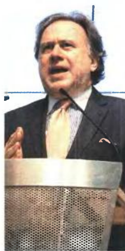
▲ ΣΥΝΑΝΤΗΣΗ με τους εκπροσώπους των Θεσμών είχε χθες ο υπ. Εργασίας Γ. Κατρούγκαλος

Χαρακτηριστικά, η κ. Βελκουλέσκου παρένεβη στη συζήτηση, όπου γινόταν παρουσίαση από τα τεχνικά κλιμάκια, επιστημονώντας με την τυπικότητα που αρμόζει στην επικεφαλής του κλιμακίου του ΔΝΤ: «Σας υπενθυμίζω ότι το Ταμείο λειτουργεί βάσει καταστατικού, το οποίο