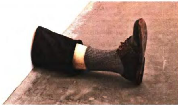
ROBERT GOBER, ΧΑΡΙΣ ΤΙΤΛΟ (1989-90)

Αντιθέτως. Με μια έννοια όσα λέω έχουν την αισιόδοξη πλευρά τους. Υπογραμμίζουν το γεγονός ότι σ' αυτήν την Ελλάδα, που τόσο εύκολα είμαστε έτοιμοι να την κατηγορήσουμε ως μόνη υπεύθυνη για όλα τα στραβά που μας συμβαίνουν, ένα «κακό αντικείμενο» που ξεσπάμε επάνω του, το κακοποιού-