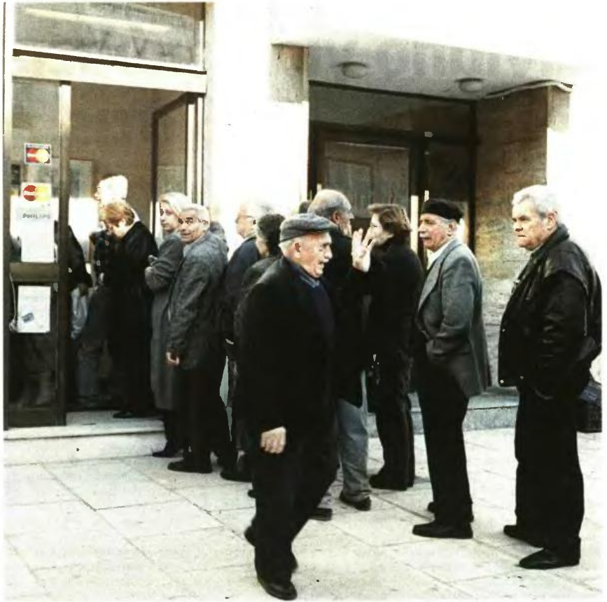
Παλιοί και νέοι συνταξιούχοι με το νέο νόμο θα δουν τη σύνταξη να συρρικνώνεται ενώ κάποιος θα κληθούν να επιστρέψουν μέρος του ποσού που ήδη έχουν λάβει.

Οι μειώσεις που θα επιφέρει ο νέος νόμος κυμαίνονται στο 3% ως 5%, ωστόσο στις νέες συντάξεις μπορεί να φτάσουν και το 15%