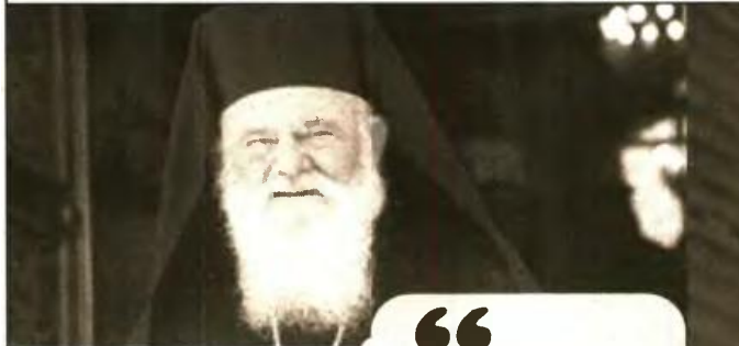
Γράφει ο Ορθόδοξος Παρατηρητής

Η ελληνική αριστερά ακολουθώντας τα αχνάρια της ευρωπαϊκής αριστεράς αρχίζει να εκτοπίζει και από το λεξιλόγιό της τα βασικά ταξικά ζητήματα και να περιστρέφεται γύρω από περιθωριακά ζητήματα μικρομεταρρυθμίσεων και "μειονοτικών ευαισθησιών". Εδώ ο κόσμος καίγεται και οι "αριστερές" ηγεσίες το μόνο "προοδευτικό" που έχουν να πούνε είναι γύρω από το χωρισμό της Εκκλησίας από το κράτος, για τον πολιτικό γάμο, τα "δικαιώματα των μειονοτήτων", το γάμο των ομοφυλοφίλων και τα παρόμοια: ευθυγραμμίζονται πλήρως με όλα τα ιδεολογικά κόπρανά του "εκσυγχρονιστικού νεοφιλελευθερισμού". Τα προϊόντα του κοσμοπολιτισμού και τα πολύπολιτισμικά ιδεολογήματα τα πλασάρουν σαν πρόοδο και τα καθιστούν "επίκαιρα" πολιτικά ζητήματα.