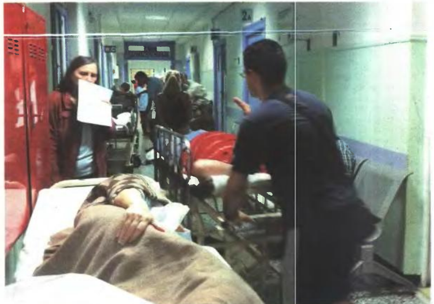
Τριτοκοσμικές συνθήκες επικρατούν στα δημόσια νοσοκομεία και εικόνα ασφυξίας στις εφημερίες, οι οποίες είναι απλήρωτες για το 2015 και βγαίνουν με μεγάλη δυσκολία.

♦ Γιατροί και εργαζόμενοι στα δημόσια νοσοκομεία συγκροτούν κοινό μέτωπο και κατεβαίνουν σε 24ωρη απεργία στις 20 Μαΐου.