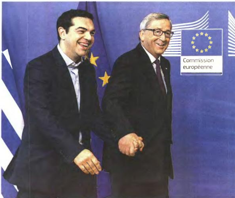
Μέσω της κοινής δήλωσής του με τον Αλέξη Τσίπρα, ο Ζαν-Κλοντ Γιούνκερ τοποθετήθηκε με σαφήνεια τόσο στο θέμα της ρύθμισης της αγοράς εργασίας όσο και σε αυτό του συνταξιοδοτικού συστήματος.

Σύμφωνα με την επίσημη ενημέρωση, οι κύριοι Τσίπρας και Γιούνκερ, στη διάρκεια της τηλεφωνικής τους επικοινωνίας, «κατέγραψαν να την πρόοδο που έχει σημειωθεί τις τελευταίες ημέρες στις συνομιλίες μεταξύ της Ελλάδας και των εταίρων της πάνω στο ζήτημα της αναλυτικής δέσμης μεταρρυθμίσε-