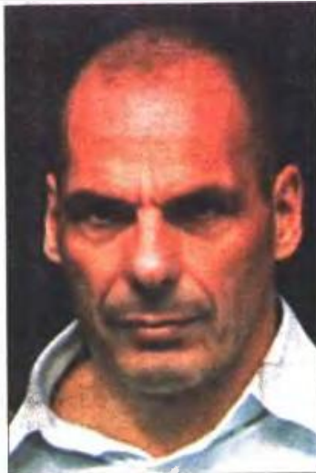
Ο Ι. Βαρουφάκης

• Μία πρόκληση για κάθε δύο αποχωρήσεις στο Δημόσιο σε συνδυασμό με επέκταση του ενιαίου μισθολογίου και εφαρμογή νέου επαναπροσλήψεων.