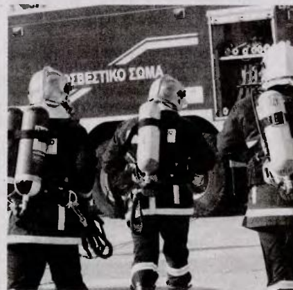
Απόφαση του διοικητικού εφετείου Αθηνών ανατρέπει τις μέχρι σήμερα πρακτικές της Πολιτείας

Εφετείο, «βάσει των ικανοτήτων και δεξιοτήτων των υποψηφίων, της ιδιότητας του πολύτεκνου ή τρίτεκνου, ως και της ιδιότητας του μέλους πολύτεκνης ή τρίτεκνης οικογένειας, μη συνδεόμενης με ικανότητες ή δεξιότητες του υποψηφίου και μη αποτελούσες κριτήριο το οποίο πληροί τις προϋποθέσεις αυτές».