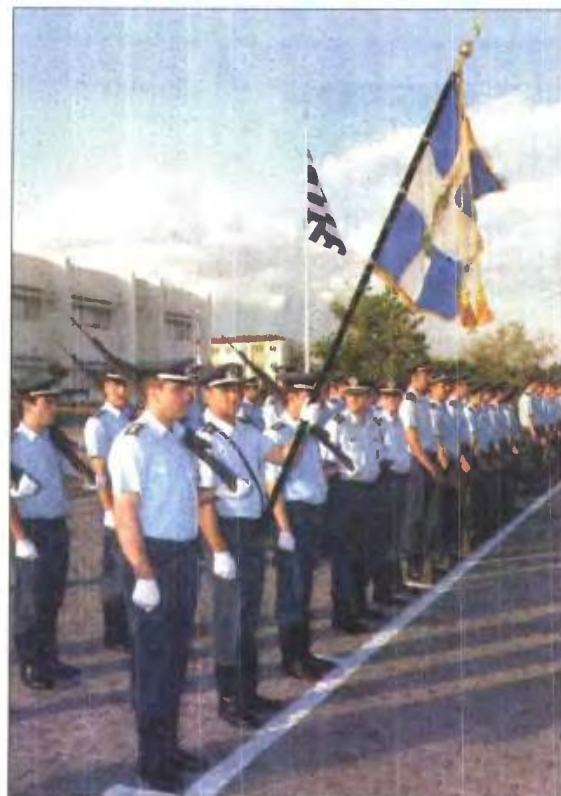
Από ορχηστωσία σε σχολή της Αστυνομίας

Επίσης, το ΣτΕ έκρινε αντισυνταγματικές τις ευ-