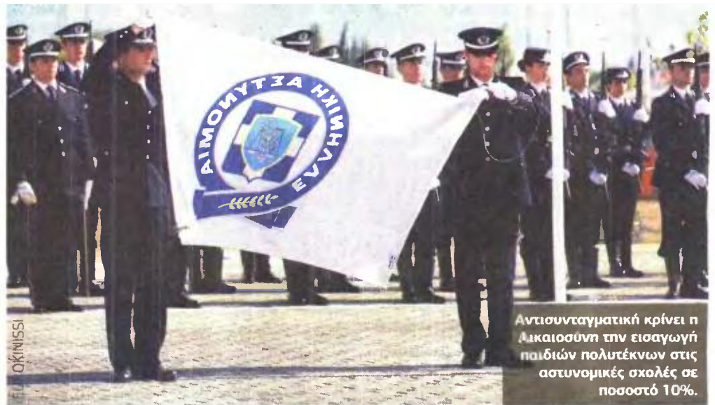
Αντισυνταγματική κρίνει η Δικαιοσύνη την εισαγωγή παιδιών πολυτέκνων στις αστυνομικές σχολές σε ποσοστό 10%.

ΓΙΑ ΕΙΣΑΓΩΓΗ ΜΕΣΩ ΤΩΝ ΠΑΝΕΛΛΑΔΙΚΩΝ Αντισυνταγματικό το «μπόνους» στους τρίτεκνους για τις Αστυνομικές Σχολές ▶ ΣΕΛ. 33